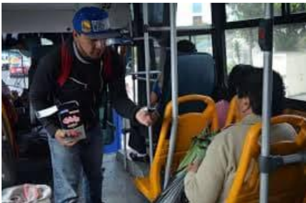
Ilustración 1 Venezolano vendiendo en un autobús urbano del sector de "El Trébol"

Anexo 3: fotos de la investigación que fueron tomadas con la autorización de las personas.