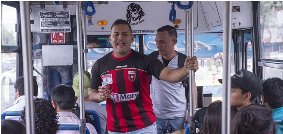
Ilustración 4: Emigrante ofreciendo sus productos.