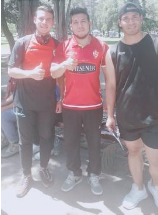
Ilustración 5: Foto posterior al diálogo con grupo focal