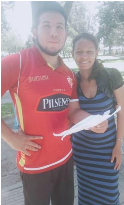
Ilustración 8: Emigrante venezolana entrevistada