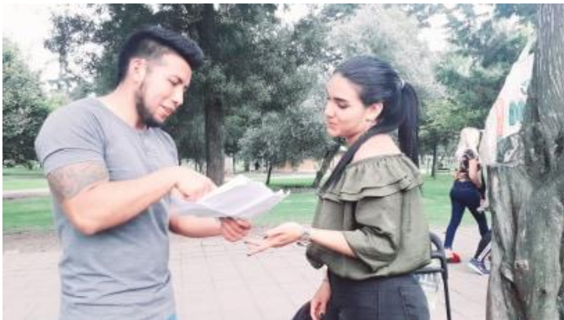
Ilustración 2 Diálogo con emigrante venezolana