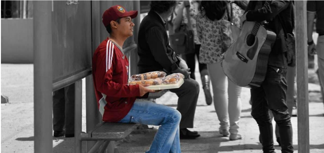
Ilustración 7: Trabajador informal ofreciendo sus productos en una parada de Quito.