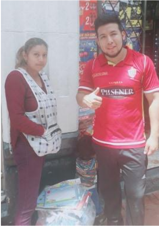
Ilustración 3: Diálogo con comerciante ecuatoriana que comparte sitio de trabajo con emigrantes venezolanos.