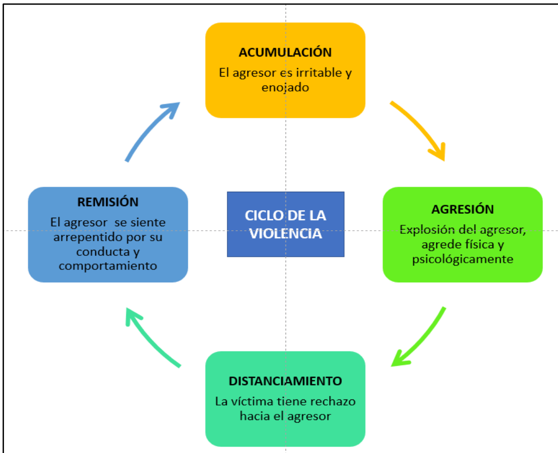
Figura 1 Ciclo de la violencia

La violencia familiar, por lo general, se establece en un ciclo de crecimiento en el cual se identifican varias fases (Consejo de la Judicatura - Ecuador, 2015) reconociendo las siguientes: acumulación, agresión y remisión, este ciclo de la violencia se describe en la siguiente figura.