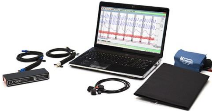
Figura 2. Elementos del polígrafo moderno, según Argo-A Security para el modelo tipo LX5000, s.f.

La permanencia de los componentes analógicos de la Figura 1 dentro de los nuevos instrumentos poligráficos, permite inferir que el parámetro básico del funcionamiento de los polígrafos modernos radica en: i) medidor de presión arterial, ii) galvanómetro, iii) neumógrafo y iv) electrodos (Synnott et al., 2015).