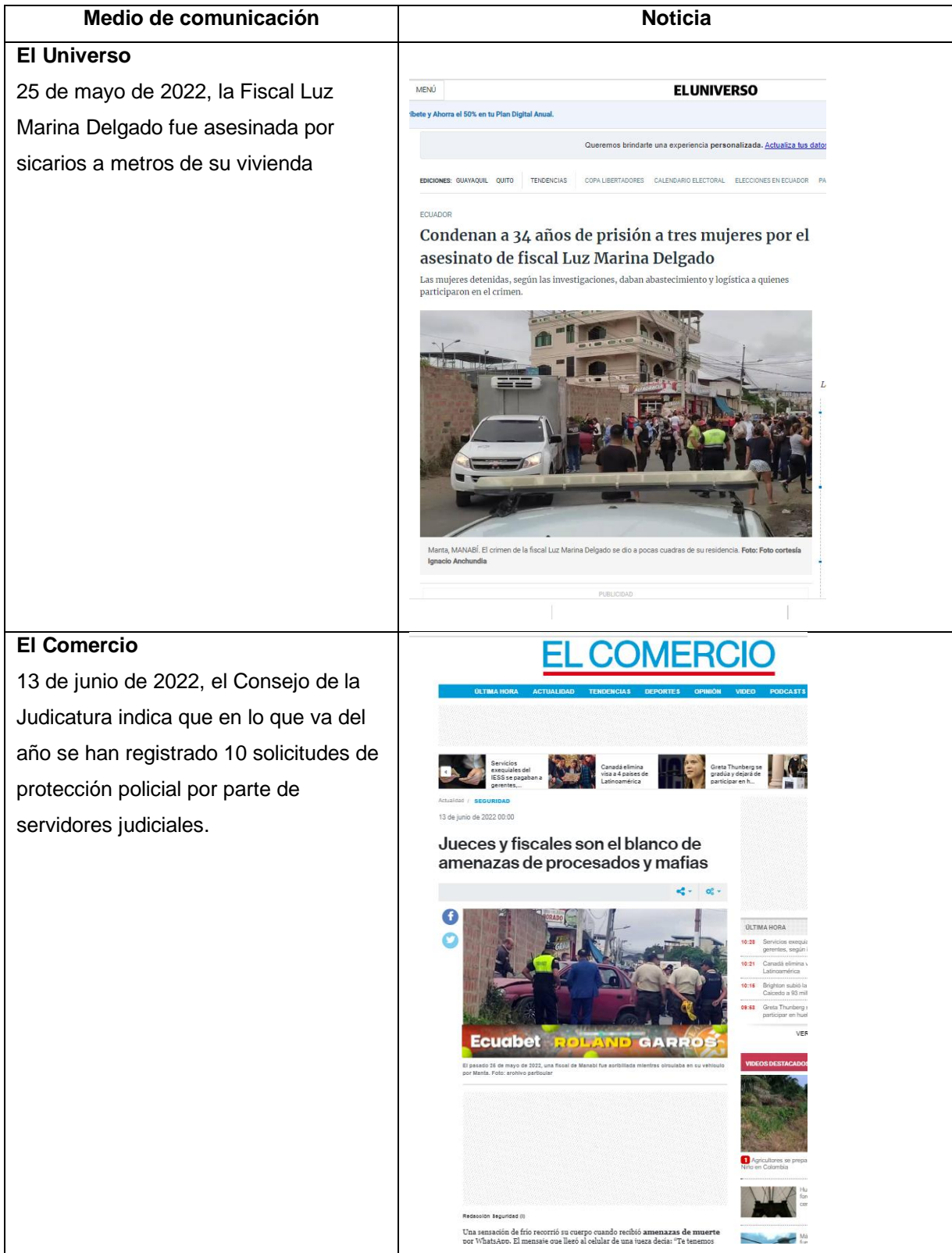
Tabla 2. Noticias del ámbito judicial y la delincuencia organizada