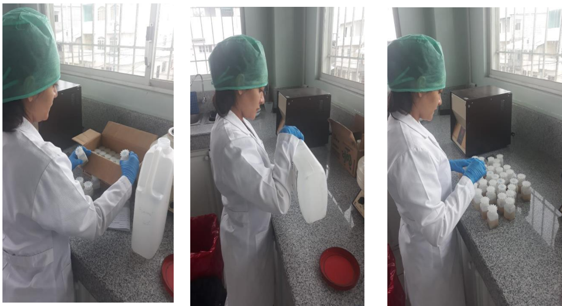
Figura 7. Proceso del método de Ritchie.