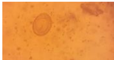
Figura 6. Huevo de Hymenolepis nana Método de Ritchie Instrumento: microscopio marca Nikon Objetivo 40X