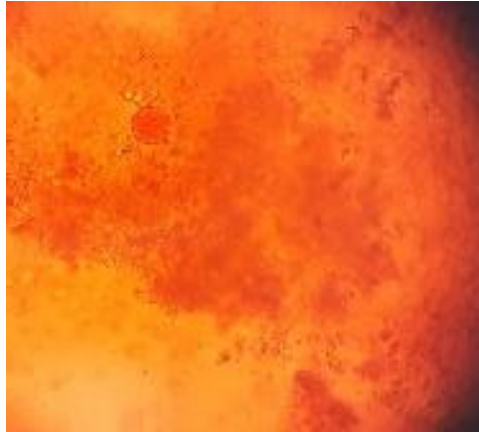
Figura 5. Quiste de Entamoeba coli , examen coproparasitológico directo con Lugol. Instrumento: microscopio marca Nikon. Objetivo 40X