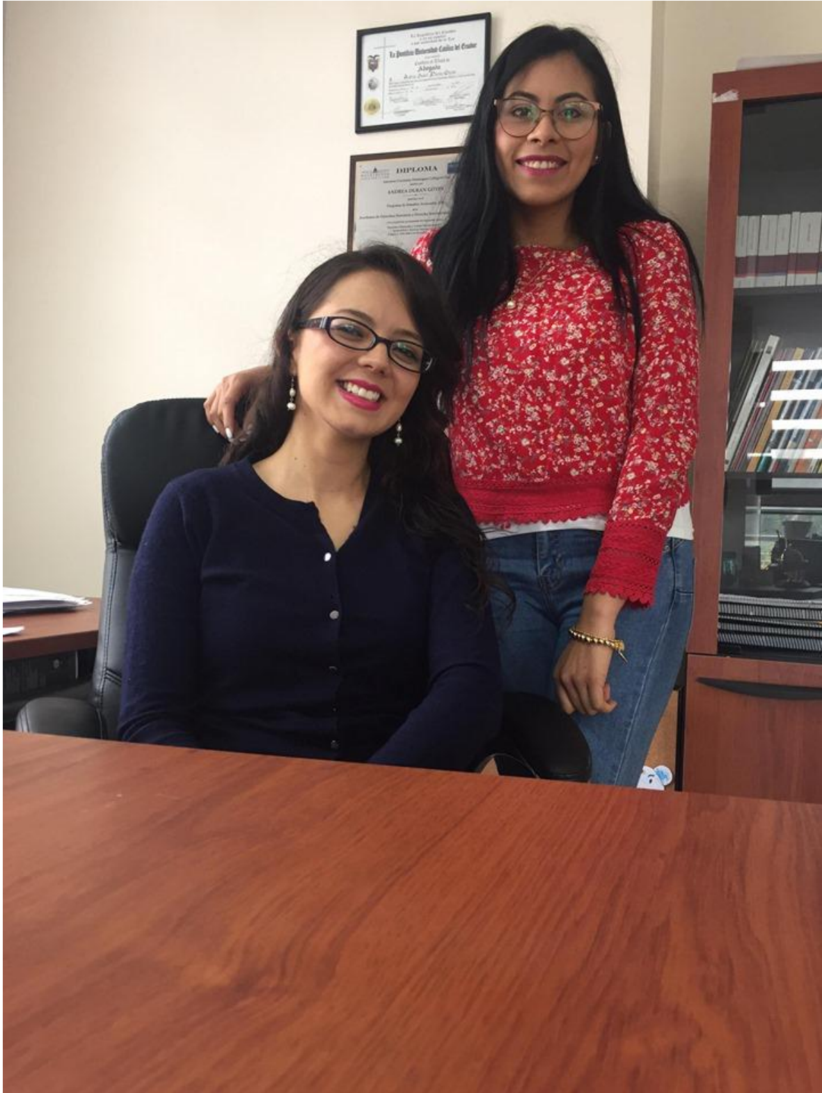
ENTREVISTA REALIZADA A ABOGADA ESPECIALISTA EN FAMILIA, MUJER, NIÑEZ ADOLESCENCIA Y DERECHOS HUMANOS