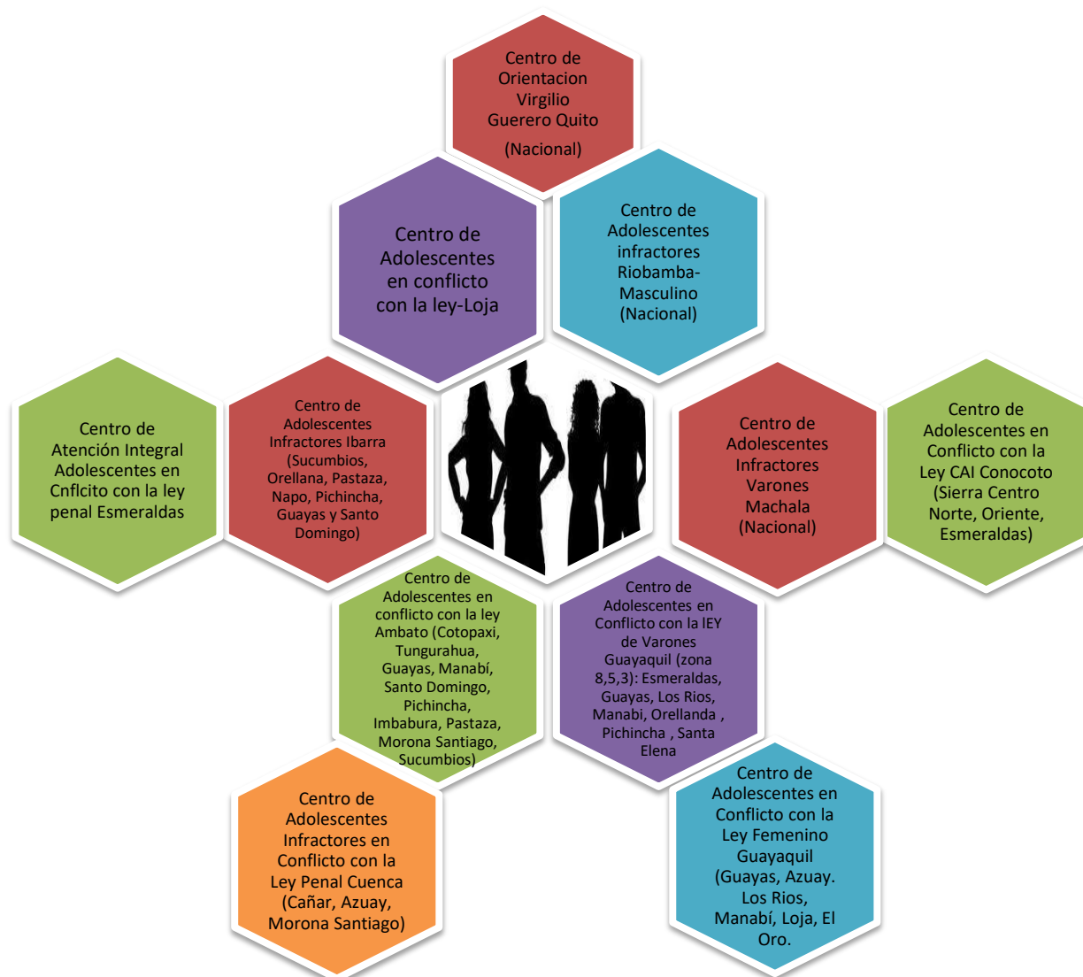
Gráfico 2: Centros de Adolescentes infractores en el Ecuador

Fuente: Elaboración propia a partir de datos obtenidos de (Defensoría del Pueblo Ecuador, 2016). Fotografía de (Confederación de Adolescencia y Juventud de Iberoamérica y el Caribe, 2013).