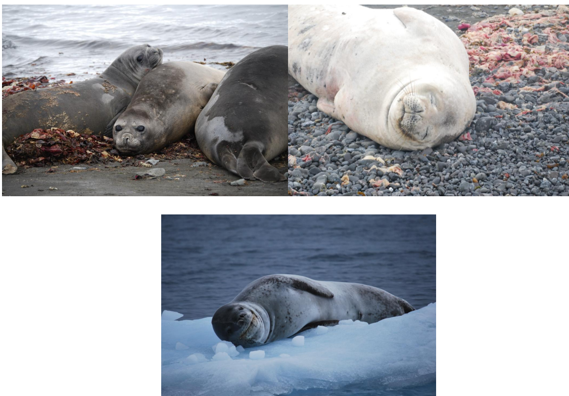
Figura 3. Focas en la Antártida. Arriba izquierda: Leptonychotes wedelli en la Isla Greenwich, Foto: Santiago F. Burneo. Arriba derecha: Lobodon carcinophaga en la Isla Greenwich, Foto: Santiago F. Burneo. Abajo: Hydrurga leptonyx en un tempango de hielo en la Bahía Chile. Foto: Diego Tirira.