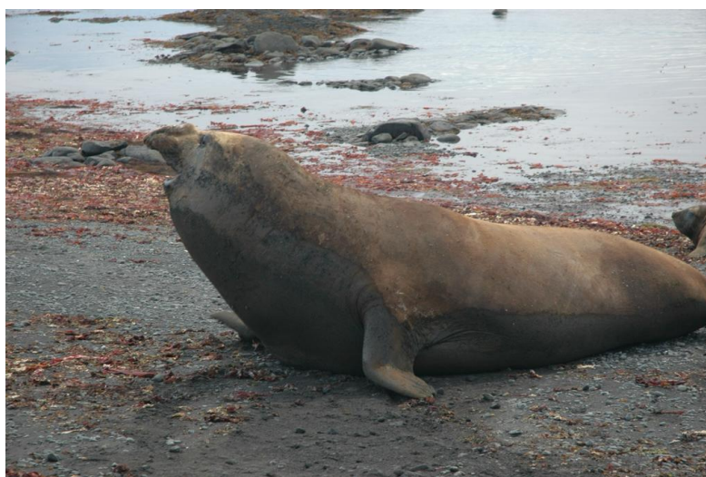
Figura 2. Elefante marino del sur. Mirounga leonina en la Isla Barrientos, Foto: Santiago F. Burneo

Las especies de pinnípedos (Carnivora: Pinnipedia) de la Antártida están clasificadas en dos familias: Phocidae, que incluye a los elefantes marinos del Sur ( Mirounga leonina , Figura 2), las focas de Weddell ( Leptonychotes weddelli , Figura 3), las focas cangrejas ( Lobodon carcinophagus , Figura 3), las focas leopardo ( Hydruga leptonix , Figura 3) y las focas de Ross ( Ommatophoca rossi ); y, Otariidae, que incluye a los lobos finos del ártico ( Arctocephallus gazella , Figura 4) y a los lobos marinos subantárticos ( Arctocephalus tropicalis ; Siniff, 1991; Boyd, 2009, Instituto Antártico Chileno, 2022). Estos grandes mamíferos acostumbran a descansar sobre las playas durante el verano, a excepción de las focas leopardo ( Hydruga leptonix ; Quintana et al., 1995).