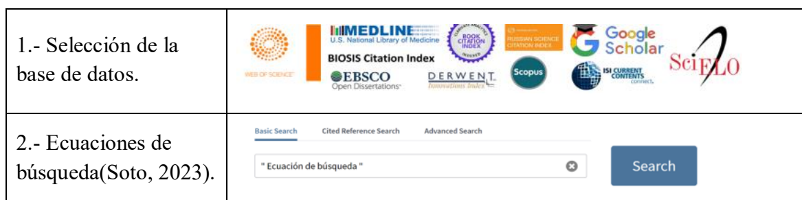
Diagrama de flujo de la revisión bibliográfica