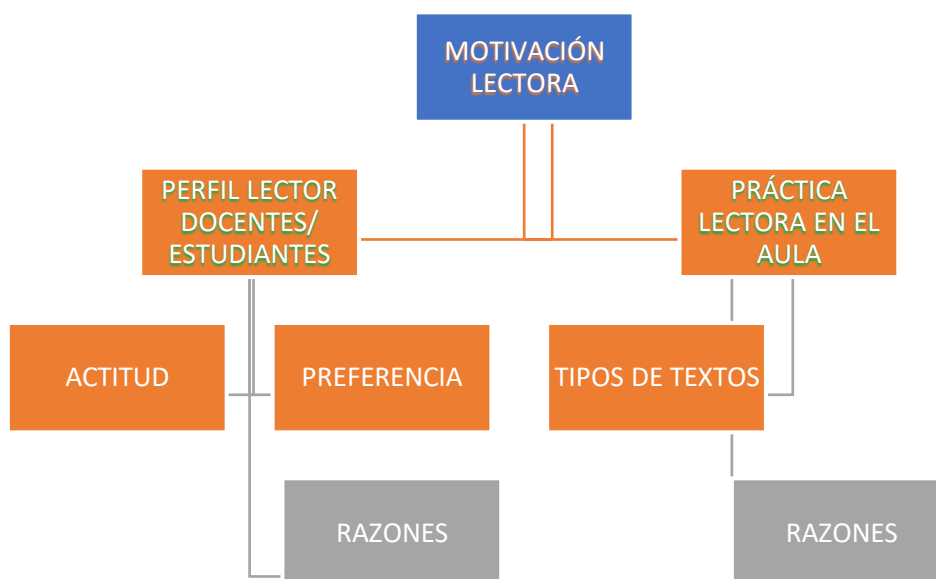
Figura 1: Esquema de categorías de la pauta de reflexión

El análisis de las respuestas de la pauta de reflexión docente evidencia que a la mayoría de los docentes participantes les atrae leer. Ellos dicen sentir interés, parecen contar con motivación hacia la lectura: