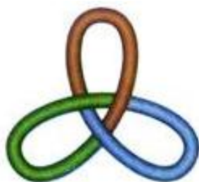
Las tres consistencias en continuidad: nudo de la paranoia.

Czermak (1987) esclarece que en la paranoia se presenta “esta continuidad de I y S, con R, debido a la equivalencia del S con \alpha ” (pág. 273), puesto que el sujeto y el Otro no están barrados, por lo tanto no ha caído el objeto \alpha , y éste se encuentra imposibilitado de convertirse en causa de deseo, no se presenta un movimiento metafórico, solamente se percibe un continuo desplazamiento. En consecuencia, la construcción del delirio, surge como una tentativa de remediar la desvinculación del objeto \alpha , y como un esfuerzo para obligar al goce desbordante a permanecer dentro de las redes del lenguaje. (Maleval, 2002)