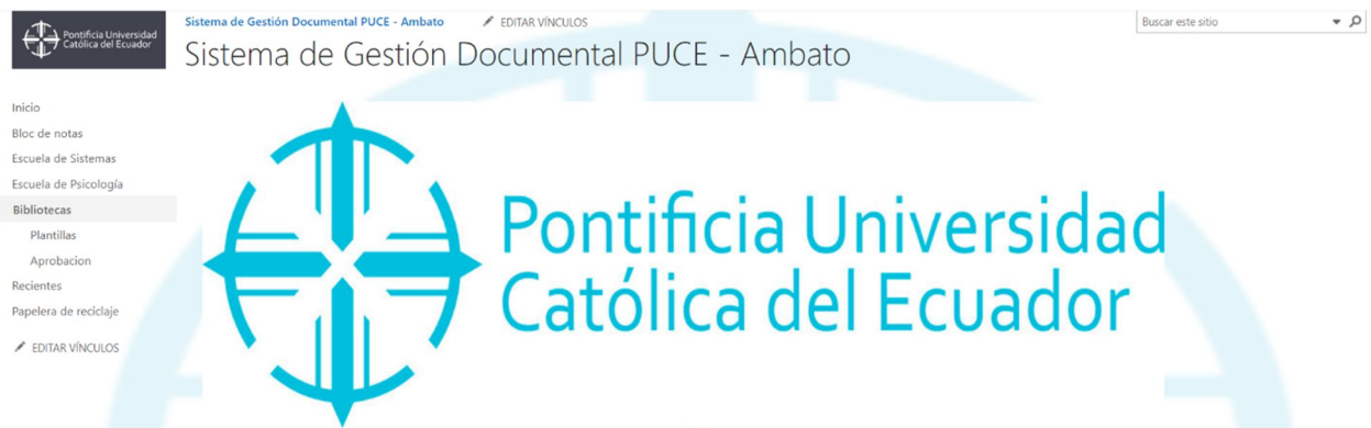
Ilustración 1: Diseño de la página principal SGD

El diseño del sistema de gestión documental se elaboró editando la página principal con datos, logos que se presenta en el manual de uso del sello institucional, a continuación, se muestra el resultado de la interfaz gráfica.