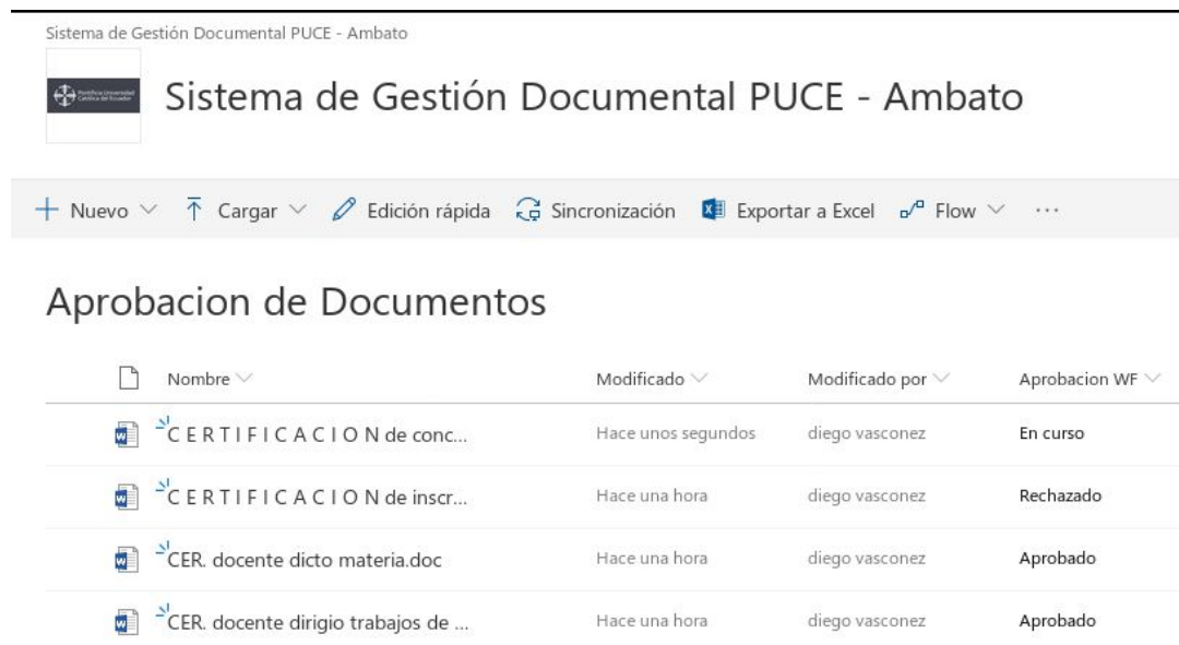
Ilustración 3: Flujo de trabajo Aprobación

Estos flujos de trabajo permiten el traslado de la información como lo requiera el usuario del sistema, con diferentes notificaciones que puede brindar la herramienta es así que se expresa en la siguiente imagen: