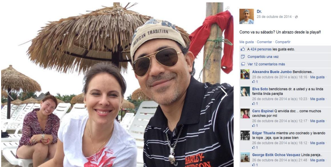
Fotografía 1: Foto compartida sobre sus vacaciones familiares