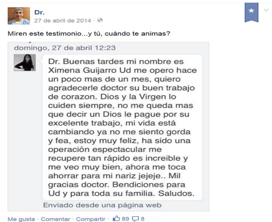
Fotografía 4: ejemplo de testimonio compartido publicamente por paciente/seguidora