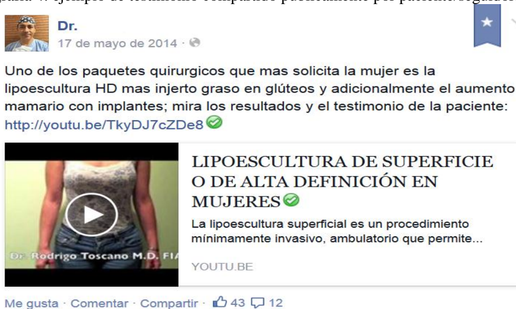
Fotografía 5: ejemplo de testimonio en video