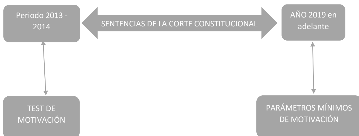
Gráfico 1: Comparativo de sentencias de la corte constitucional por periodos

En la Sentencia No. 1158-17-EP/21, “La actual Corte, se alejó del conocido test de motivación, es un alejamiento explícito de este precedente, el motivo de este documento es evitar la arbitrariedad que las decisiones sean más razonables, en la misma sentencia lo denomina pautas jurisprudenciales para saber lo que en realidad es la motivación, donde el juzgador lo hace con suficiencia y poder hacer un verdadero control sobre las decisiones judiciales. Las deficiencias motivacionales son las que suscitan en la sentencia tales como la inexistencia de motivación, entonces si la motivación la conforma de una premisa fáctica, premisa normativa y una conclusión, si una de estas no la aplican existe una vulneración a la motivación”.