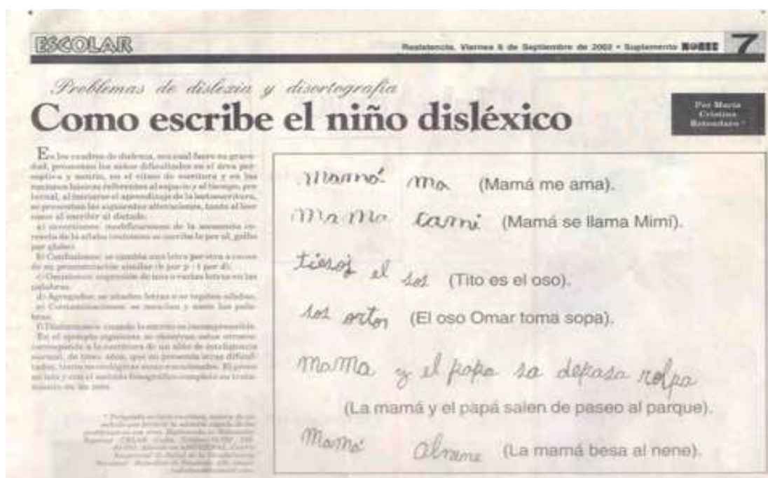
Cuadro 271 Imagen utilizada para enseñar como escribe un niño con TEA

La disgrafia implica una inhabilidad para controlar adecuadamente el ritmo y el ordenamiento de la escritura en una línea, por una alteración a nivel psicomotor, que puede ir acompañado de alteraciones a nivel visual de la orientación espacial, que impiden una regulación adecuada. 270