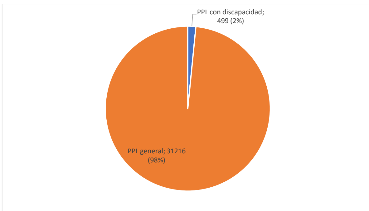
Gráfico 1. Porcentaje población carcelaria con discapacidad a nivel nacional