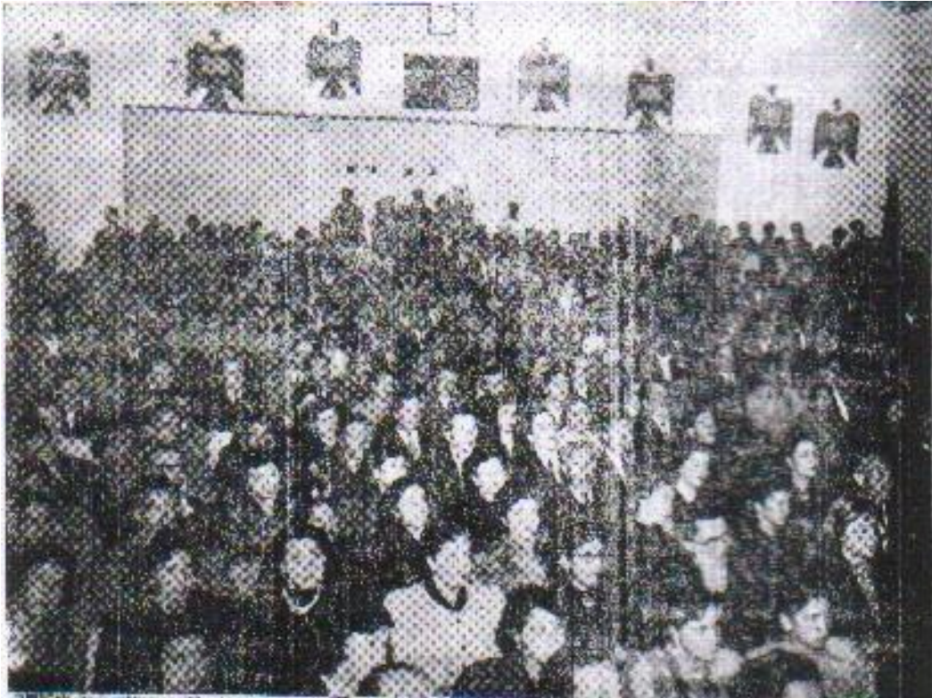
Asamblea de ARNE - Acción Revolucionaria Nacionalista Ecuatoriana en su décimo aniversario (1952)