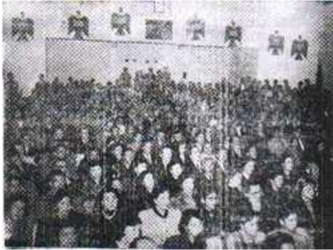
Militantes de ARNE, en su sede. Década de 1950.