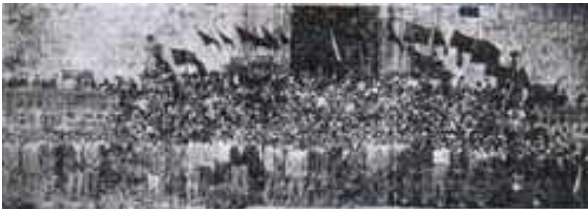
Concentración "arnista" en su décimo aniversario en 1953.