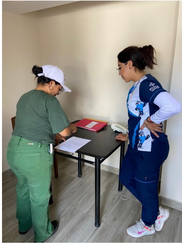
Fotografía 1. Revisión correspondiente a permisos e historias clínicas.