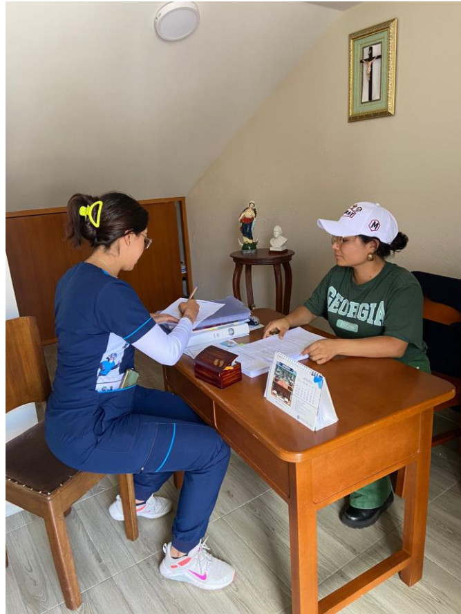
Fotografía 2. Revisión de historias clínicas para tabulación.