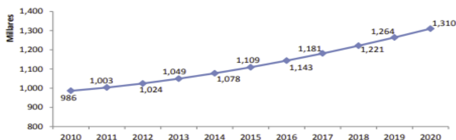
Evolución cuantitativa de adultos mayores en Ecuador 2010-2020

Nota. Se observa en el gráfico cómo la cantidad de adultos mayores en Ecuador ha venido ascendiendo de manera sostenida en la década 2010-2020. Tomado de Proyecciones Poblacionales del INEC, Censo 2010.