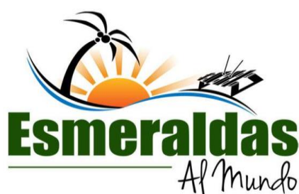
Figura 13: Marca GAD municipal Esmeraldas al mundo

Este tipo de marcas cumple las mismas o en su mayoría, las características que presentan una marca territorial o una marca turística, con el detalle que estas marcas políticas se atienen u obligatoriamente son reemplazadas. Están van cambiando de acuerdo el periodo político que esté vigente, cabe aclarar que este cambio no es un rediseño de la marca, si no que la creación de una totalmente nueva.