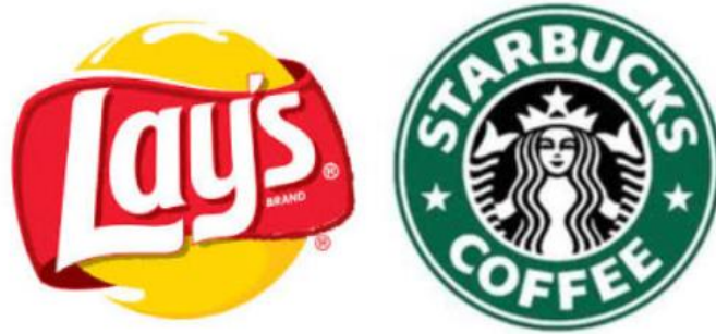
Figura 3: Isologo de Lay's y Starbucks

Isologo: Al igual que los imatipos, los isologos también manejan una parte icónica y textual, pero a diferencia de los imatipos, estos trabajan juntos y no se pueden separar, si no pierden el sentido y el concepto.