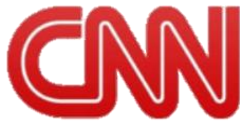
Figura 6: Sigla/Isotipo de CNN

Sigla: Es igual que el monograma, simplemente que este es más legible y pronunciable de manera separada.