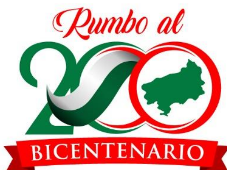
Figura 14: Marca GAD municipal Bicentenario Esmeraldas