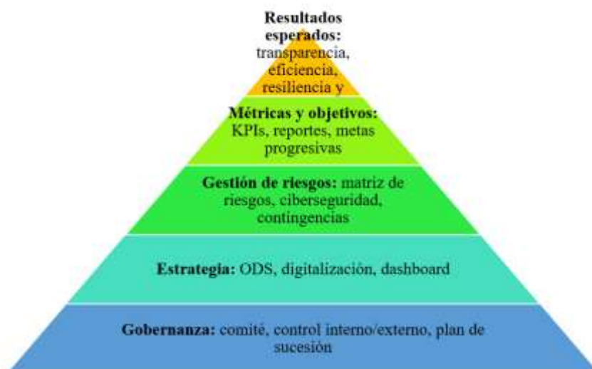
Figura 2. Propuesta NIIF S1 en SIALAD S.A. - Esquema pirámide