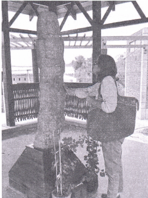
Figura 1. San Biritute

Revisamos a continuación dos casos que muestran, con mayor detalle, la discrepancia que se produce entre una política cultural patrimonial no consultada ni consensuada con las comunidades y las distorsiones que estas acciones producen en el tejido social.