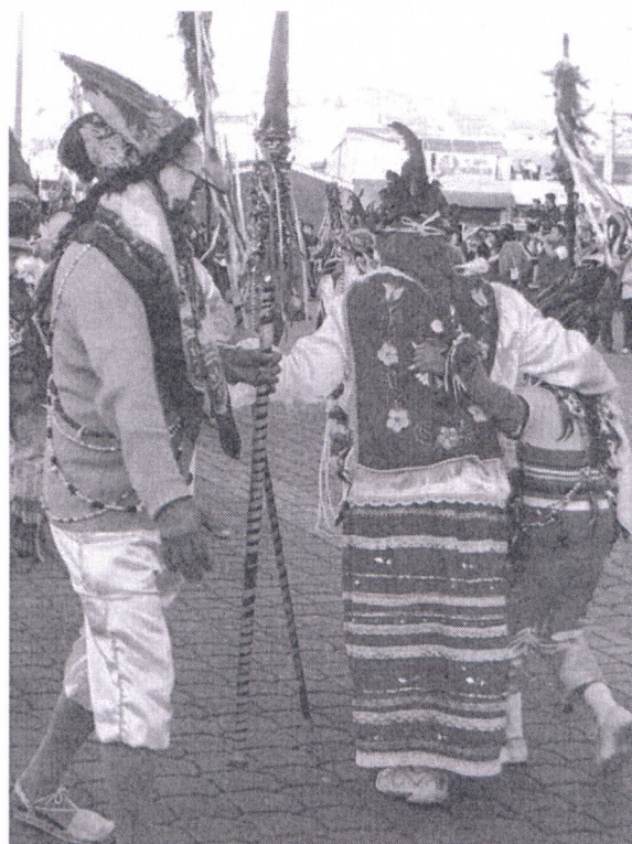
Figura 2. Los Yumbos de Cotocollao

Finalmente reconocen que los resultados de nuestra investigación fueron claves para conocer documentadamente otros casos de malas prácticas patrimoniales. (figura 2.)