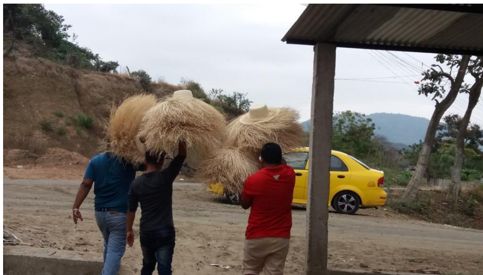
Figura 4. Intermediarios de Montecristi compran los sombreros sin acabar en Picoazá