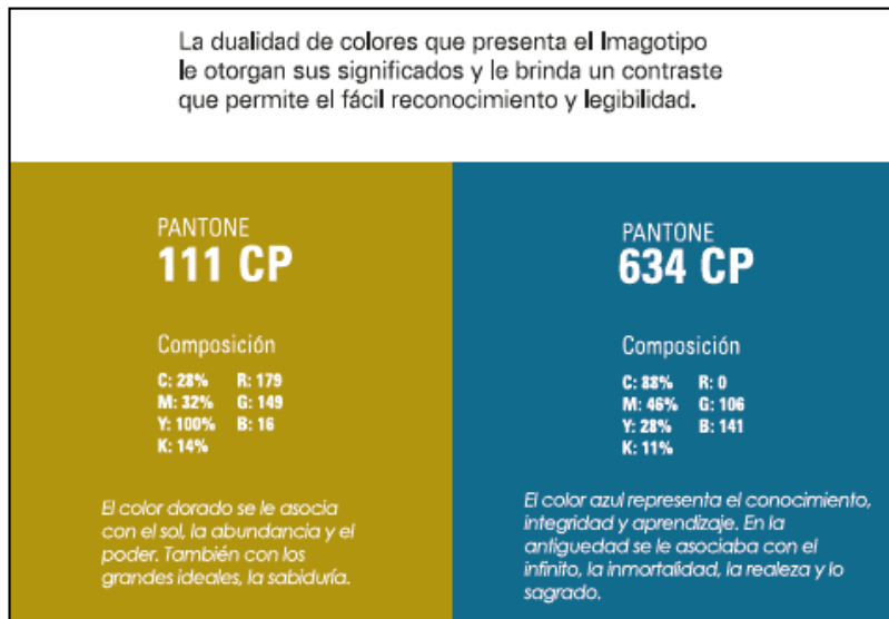
Figura 8. Selección cromática del Imagotipo de la Marca Picoazá Toquilla Quality