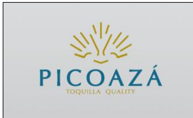
Figura 6. Logo oficial de la Marca Picoazá Toquilla Quality