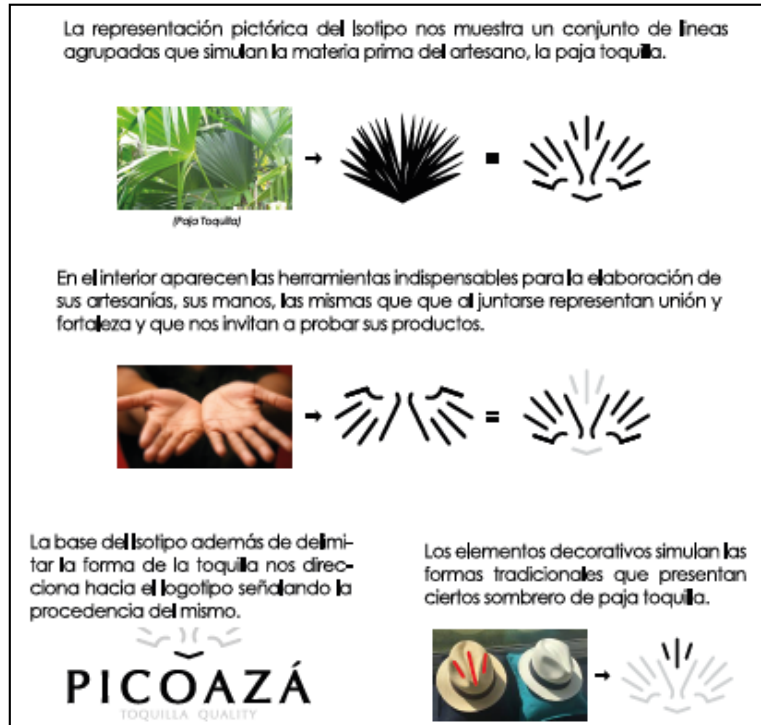
Figura 5. Construcción de la Marca Picoazá Toquilla Quality y su significado