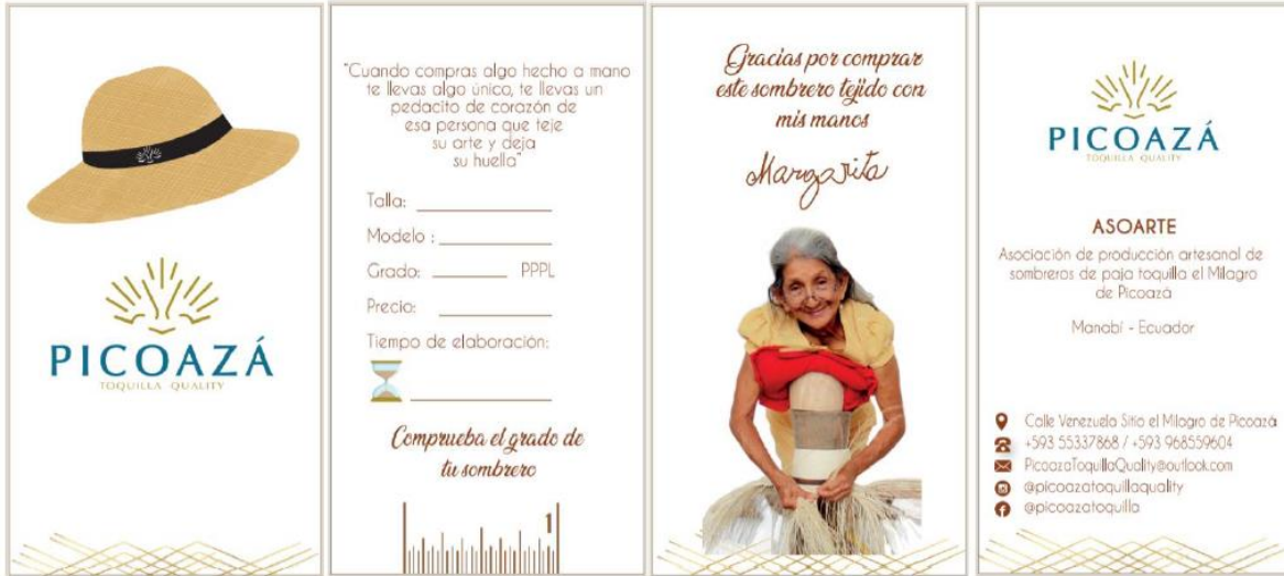
e) Etiqueta externa