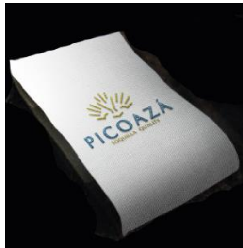
d) Etiqueta Interna