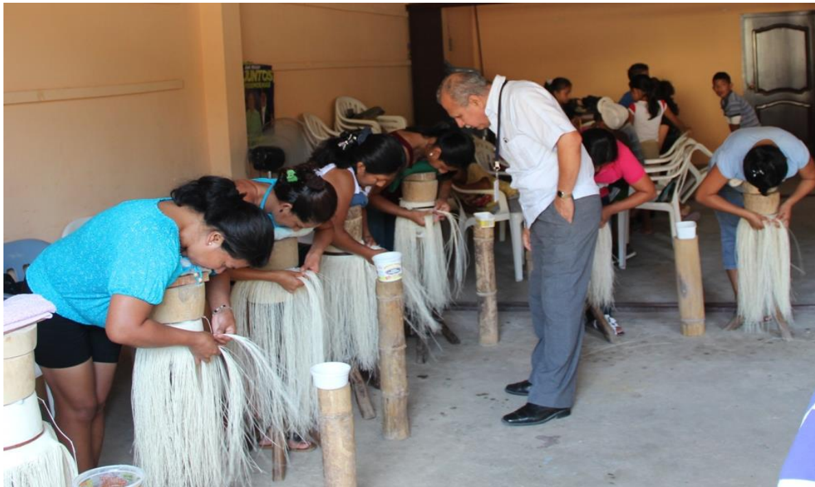
Figura 3. Tejedoras de sombreros de Paja Toquilla en la posición particular de las tejedoras de Manabí (agachadas y en una olma) que la diferencia del resto del país.