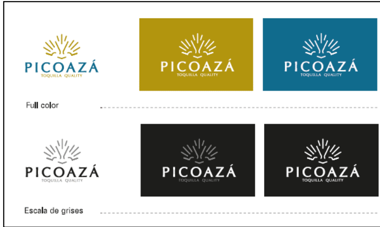
Fuente: Manual de Marca. Documento facilitado por el GAD de Portoviejo