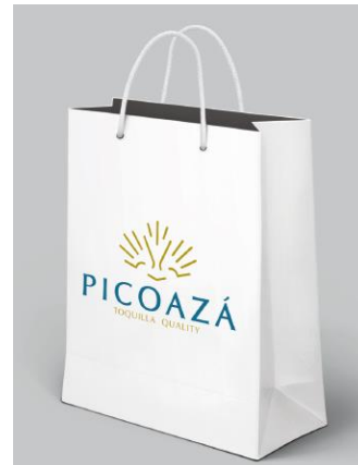
b) Bolsos de empaque