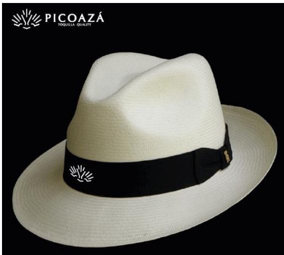
c) Isotipo en tafilete (cinta)