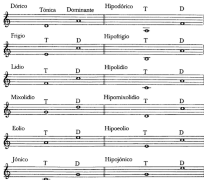
Figura: 6 partitura explicativa de tónica y dominante en modos (Herrera, 2004).

Finalmente se añadió el modo desde la nota Si llamándolo “locrio” y la tabla quedaría completa con siete escalas diferentes, de la cual sobresalieron la “eólica” y la “jónica” convirtiéndose después en modos mayor y menor respectivamente.