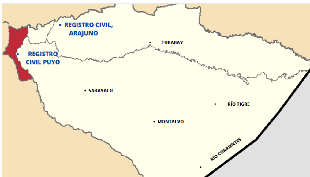
Mapa 2. Ubicación de agencias del Registro Civil, Identificación y Cedulación en Pastaza.

Respecto a la institucionalidad del Estado en cuanto al registro de nacimientos, el Registro Civil, Identificación y Cedulación es la entidad encargada del registro de nacimiento. En la provincia de Pastaza, según la Dirección General de Registro Civil Identificación y Cedulación (DIGERCIC), existen 2 agencias, una en la ciudad de Puyo que es la capital de la provincia y la segunda en el Cantón Arajuno.