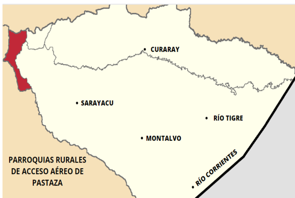
Mapa 1. Parroquias rurales de acceso aéreo de Pastaza.

Es importante conocer la ubicación de las parroquias Curaray, Sarayacu, Montalvo, Río Tigre y Río Corrientes, para proporcionar una visión general de los lugares mencionados en la presente disertación, como se encuentra en el mapa que procede.