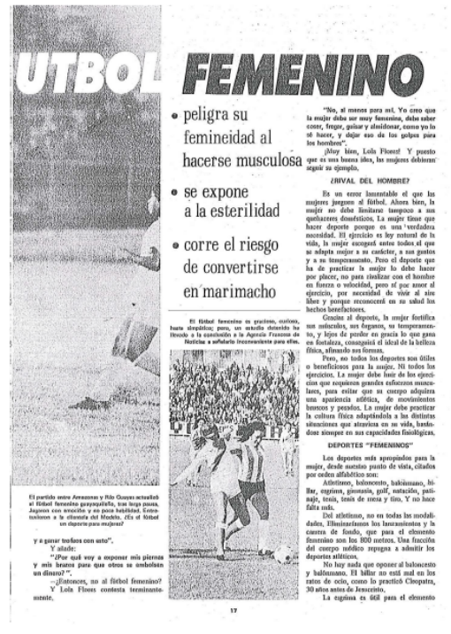
Facsimil del artículo de A. Karag en la revista Estadio, 1972: