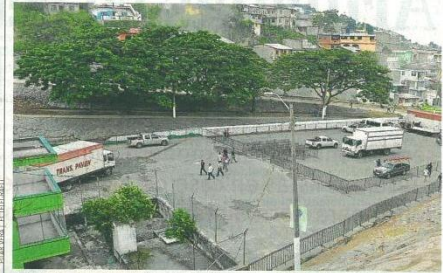
Trabajadores instalan la tarima donde estarán las autoridades de Alianza PAIS.

Los hoteles de la ciudad y de las playas aledañas estaban ayer llenos. En la convención se reformarán los estatutos de AP y se renovará su directiva.