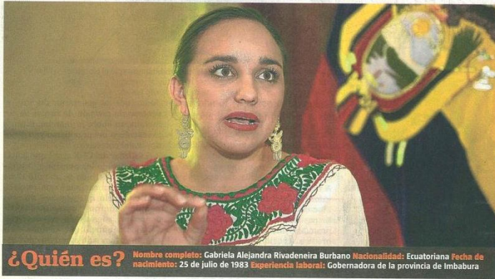
¿Quién es? Nombre completo: Gabriela Alejandra Rivadeneira Burbano Nacionalidad: Ecuatoriana Fecha de nacimiento: 25 de julio de 1983 Experiencia laboral: Gobernadora de la provincia de Imbabura

La presidenta de la Asamblea Nacional reconoce la necesidad de construir nuevos liderazgos que puedan tomarle la posta a Rafael Correa. Ella quiere una estructura más fuerte en PAIS.