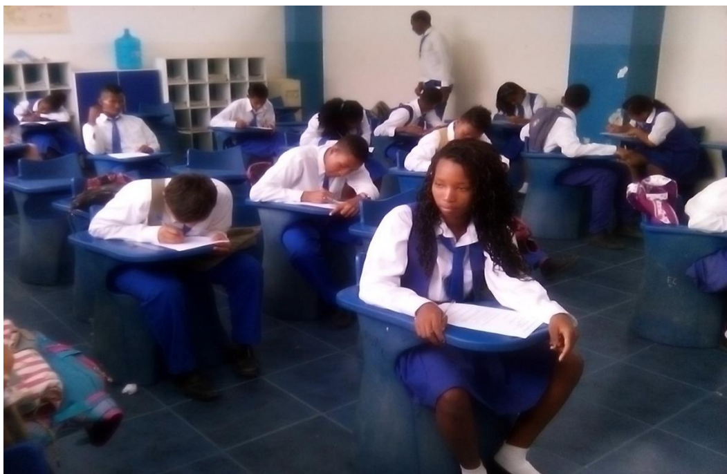
Aplicación de la ficha de observación en el aula