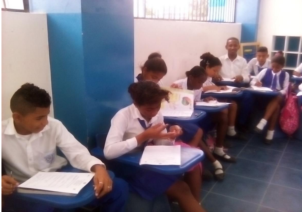
Estudiantes de noveno año EGB

Estudiantes de octavo año realizando encuesta