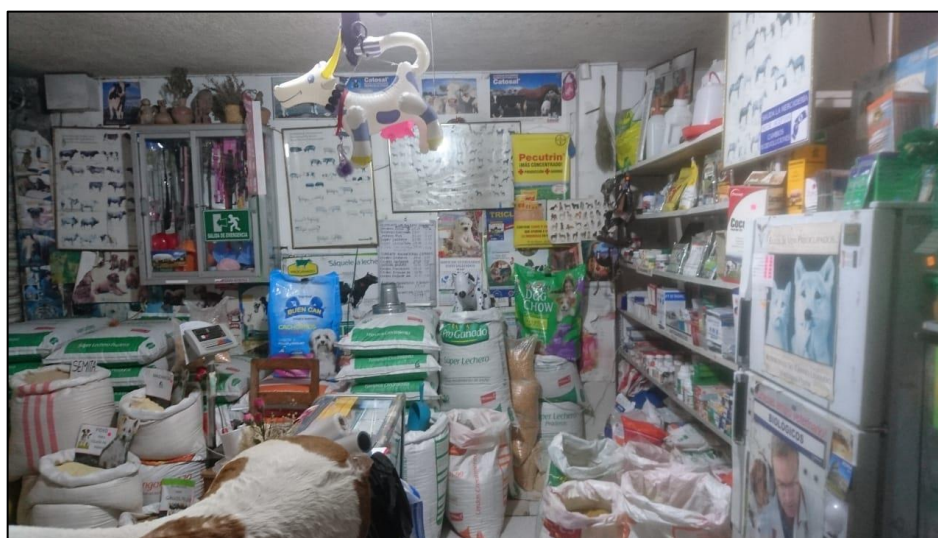
Ilustración 3 Vista interna SVE alimentos balanceados