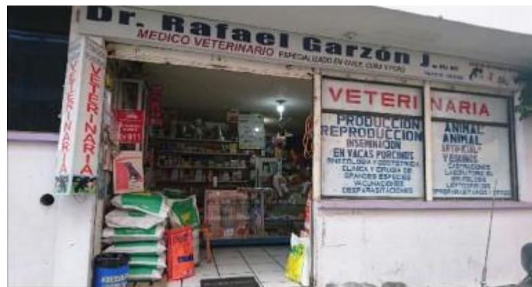
Ilustración 1 Vista externa SVE

La empresa se encuentra entre las calles 24 de Mayo y Luis A. Martínez diagonal a la Casa Campesina “FECOS” en la ciudad de San Miguel de Salcedo. Esta ubicación la mantiene hace ya aproximadamente 20 años. Para mayor información sobre el espacio físico de la empresa referirse al Anexo 1 Plano Servicios Veterinarios Especializados.