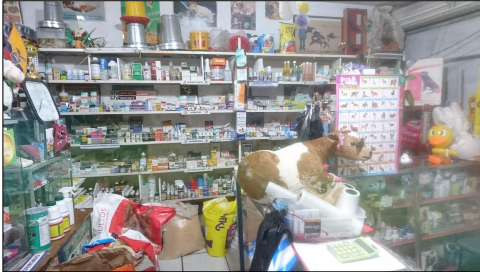
Ilustración 2 Vista interior SVE

Luego vieron la necesidad de contar con sus propios remedios veterinarios los cuales posteriormente se transformarían en el giro principal del negocio.