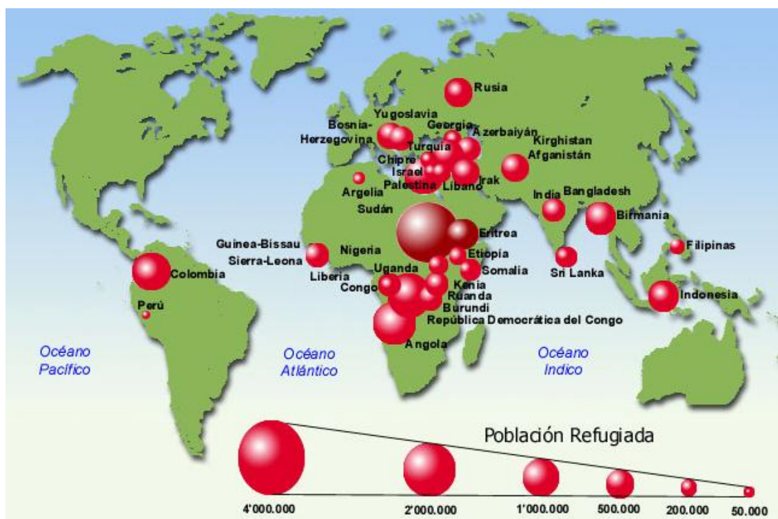
Gráfico 3. Desplazados en el Mundo

Fuente: Le Monde Diplomatique, Abril 2001 88