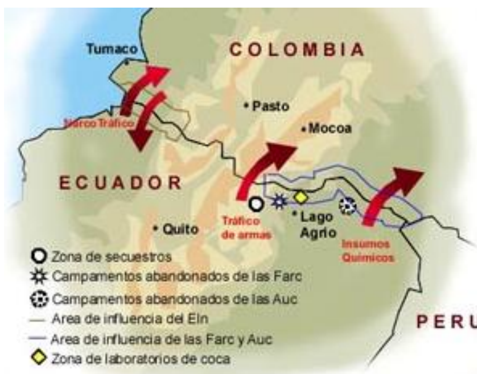
Gráfico 5. Puntos críticos de la frontera Ecuador – Colombia