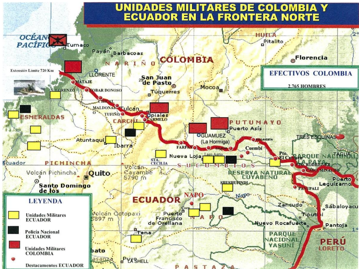
Gráfico 8. Presencia de Unidades Militares de Colombia y Ecuador en la Frontera Norte

FUENTE: Fuerzas Armadas del Ecuador 2009 143