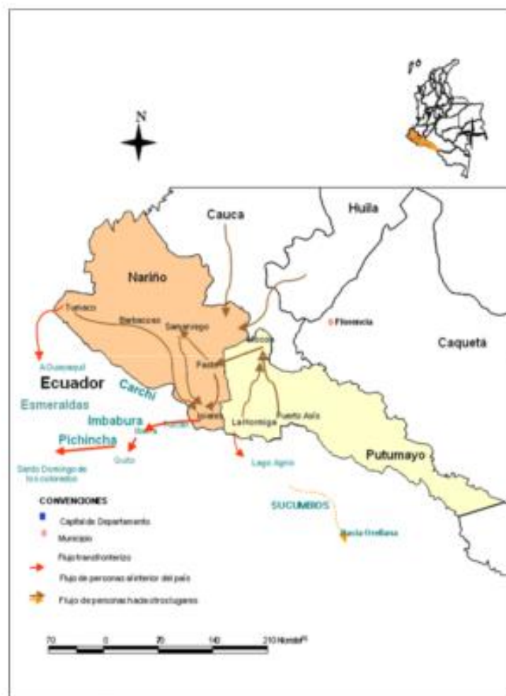
Gráfico 4. Dinámica de movilidad en la Frontera Norte