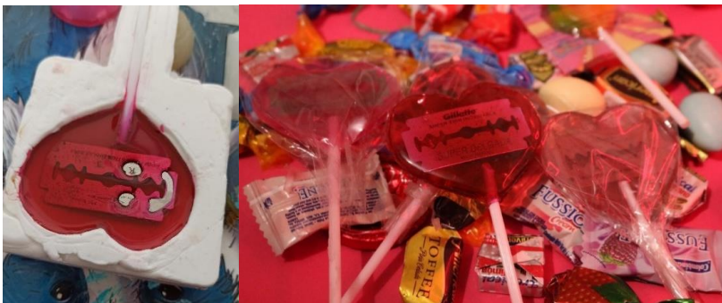
Figura 7. Foto: Paula Silva. Paletas Gillette, realización y resultado. 23 julio del 2020

Para la realización de esta obra decidí a usar las navajas de autoflagelación que había confiscado a mi ex pareja en un intento por frenar su proceso autodestructivo. Estas navajas constantemente las vi como un recordatorio a ser especialmente atenta, preocupada y devota a mi pareja por la fragilidad emocional de esta persona, un constante memorándum a la ansiedad que tenía de que esta persona pueda acabar con su vida. Después de haber abierto los ojos, estas navajas me recordaban a las veces que mi pareja exageró su situación mental para desentenderse de responsabilidades, manipularme a mí y aquellos que la rodeaban y tenerme en su poder aún después de haber disuelto nuestra relación. Tomé dichas navajas y realicé un molde en forma de paleta de corazón, sin embargo, en mi primer intento de realizar la paleta de caramelo, este se tornó muy oscuro, con muchísimas burbujas y con grietas, por lo que decidí resolverlo en resina tinturada de rojo y rosado con cierta transparencia que asegurara la vista de la navaja en el centro.