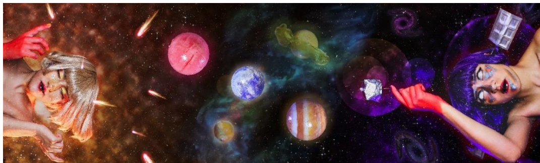
Figura 11. Foto: Paula Silva. Satélite. 24 de agosto del 2020

Para la realización de la fotografía adapté al maquillaje de las chicas la mano roja indicando la pasión e intentando aludir al corazón, La adoptando su mano cerrada mientras Da teniéndola abierta y relajada. El maquillaje facial de La consiste en colores en mayoría fríos y de aspecto metálico al igual que un accesorio en los oídos que intentan representar a la visualidad de un satélite o un ente metálico, mientras que el maquillaje de Da viene a ser colores cálidos y detalles de pan de oro en sus pómulos y nariz. La fotografía fue realizada con un montaje, primero tomé la imagen de La y Da en un fondo negro y luego individualmente fotografías de cada uno de los planetas.