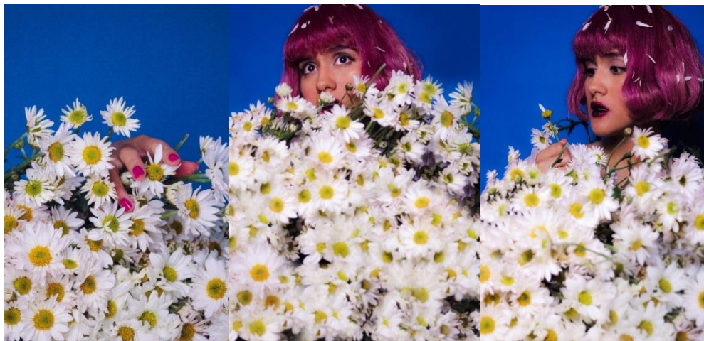
Figura 4. Foto: Paula Silva. Me quiere, no me quiere. 4 de agosto del 2020

En esta obra tomo esas inseguridades y las asocio al juego de “me quiere, no me quiere” donde se toman margaritas y cada pétalo es un simbólico “me quiere” o un “no me quiere”. A modo de oráculo se consulta a la flor por un amor incierto, pero puesto que la inseguridad y la ansiedad no son una mezcla saludable, se puede seguir preguntándose y preguntándose en distintas flores, aún sin saber la respuesta concreta, similar a lo que experimento con mis pensamientos ansiosos.