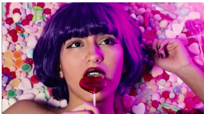
Figura 8. Sugarcoated. 8 agosto del 2020

abruptamente a negra y se escucha el sonido de una navaja, se puede llegar a asumir que llegué al centro y me corté con la verdad que este aparentemente dulce escondía.