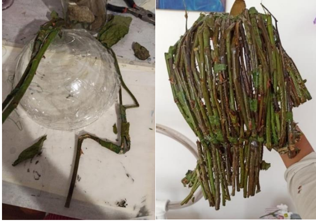
Figura 5. Foto: Paula Silva. Realización perfil de escultura de espinas. 16 julio del 2020

Para la realización de esta obra tuve que realizar una estructura en forma de un perfil humano a partir de tallos de rosas, una vez realizada la forma del rostro ubiqué las zonas con menos cantidad de espinas y las rellené, finalmente recubrí toda la estructura de resina para mayor durabilidad. Me aseguré de añadir especialmente espinas a la altura de los labios de la escultura, a pesar de que las espinas no sean lo suficientemente filudas para atravesar los labios, yo sentía la importancia al momento de grabar de poder tener ese dolor palpable. El set para el video fue realizado con un fondo negro para resaltar los colores de ambos sujetos en la escena. Puse las cabezas de las rosas en la base de las espinas y me ubiqué frente a esta de perfil para tener tomas continuas simétricas. Realicé dos tomas, una sin el uso de sangre falsa y una con ella. Finalmente me decidí por utilizar la toma que tenía la sangre.