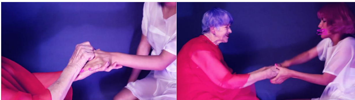
Figura 3. Si tú me quisieras. 17 de agosto del 2020

¿Tiene tinta tu tintero? ¿Tiene plumas tu plumero? ¿Tienes alguien que te quiera? ¿Me podrías decir su nombre? Si “X” te quisiera este dedo sonaría