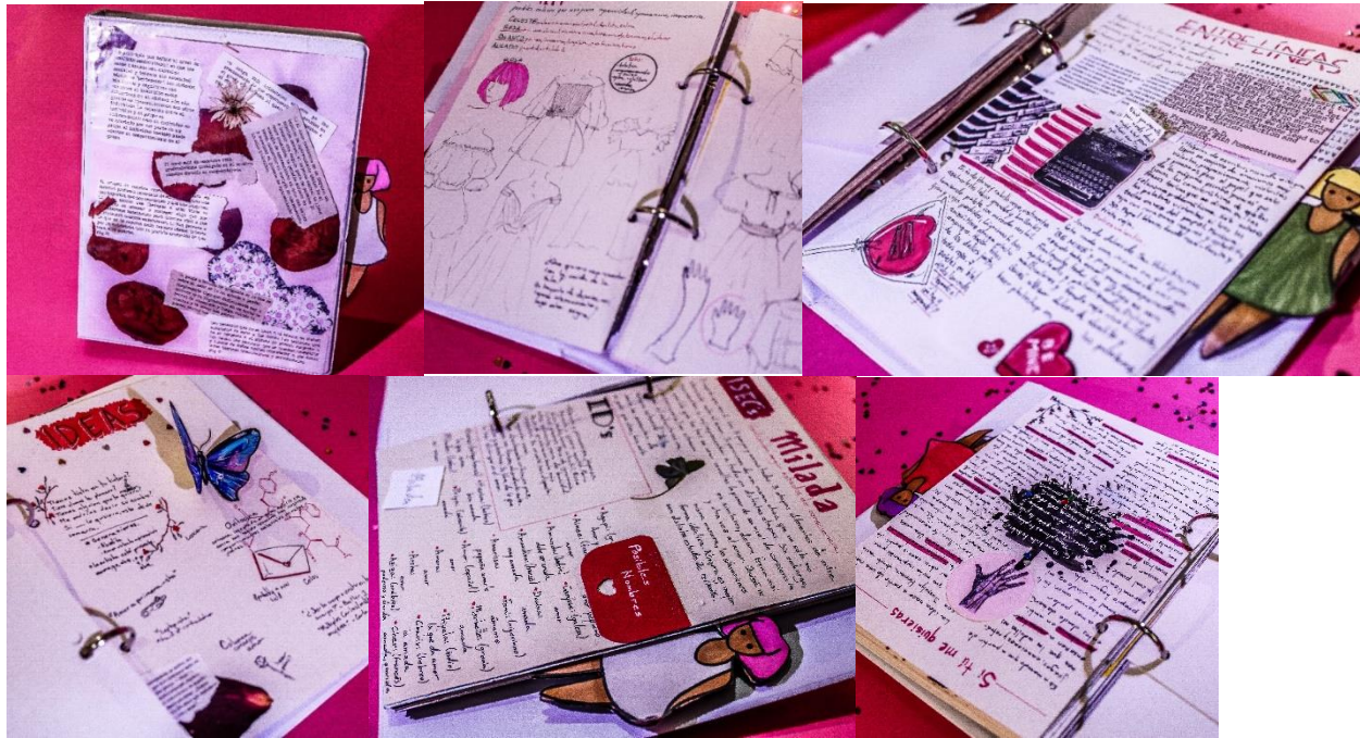
Figura 1. Diario de artista. 19 de octubre del 2020

las cuales me he identificado. Tomo esos recortes y los adhiero de igual forma en la página del diario que correspondan. Finalmente describo, dibujo o realizo un collage sobre cómo me interesaría llegar a la resolución estética de la pieza. Este diario me acompaña en todo mi proceso.