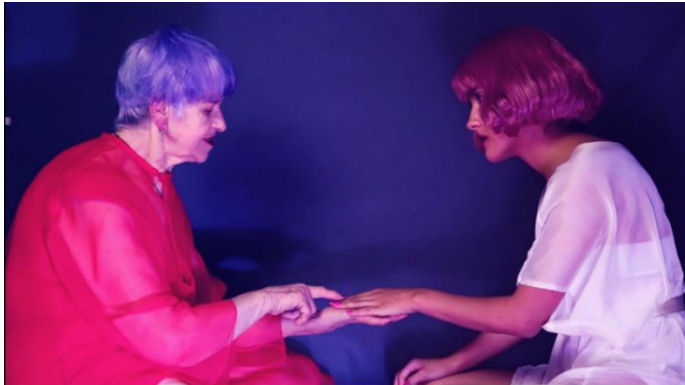
Figura 2. Si tú me quisieras. 17 de agosto del 2020

estamos conversando”, “te molesta por que le gustas”, o “aunque pegue, aunque mate, marido es.” Frases así no han sido ajenas a mí en medio de mi crecimiento y tristemente, es probable que tampoco para el resto de la sociedad. Son frases que, aunque pequeñas y aparentemente inofensivas se inculcan desde nuestros mayores, nuestros antepasados a modo casi de herencia nos dejan estas enseñanzas, inculcando a nuestra mente que amar es aguantar, que el amor va mano en mano al dolor y el abuso.