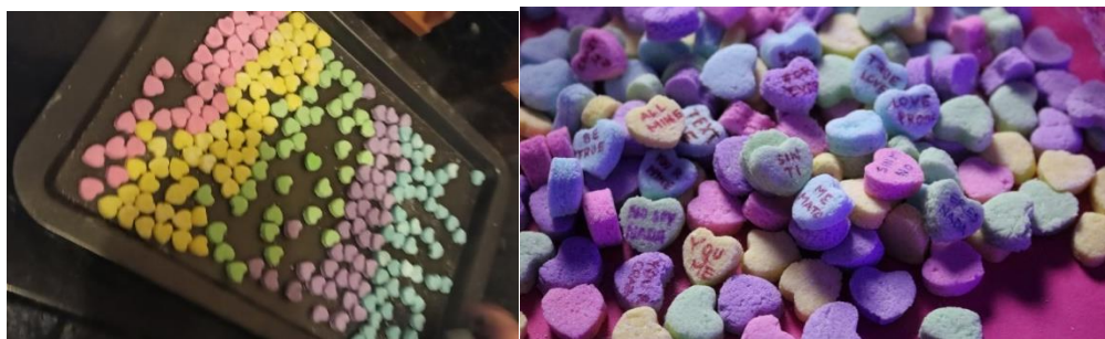
Figura 9. Dulces tipo Sweethearts caseros. 8 agosto del 2020

Las frases que me dedicaría a escribir a mano fueron frases que me han dicho a mi persona y frases que amigas y familiares quisieron compartirme tales como “Sin ti me muero” que luego también la interpreté como “Sin ti me mato”, un intento de alagar a la pareja que es realmente es más un peso y casi una amenaza, también el “Sin ti no soy nada” y “No eres nada sin mí”, pasar del “loco por ti” al “estás loca”, “me haces sentir que soy alguien bueno”, “sólo por ti sigo en pie”, “jamás me dejes”, “eres sólo mía”, “Si no eres mía no serás de nadie”, “dame la prueba de amor”, entre otras frases.