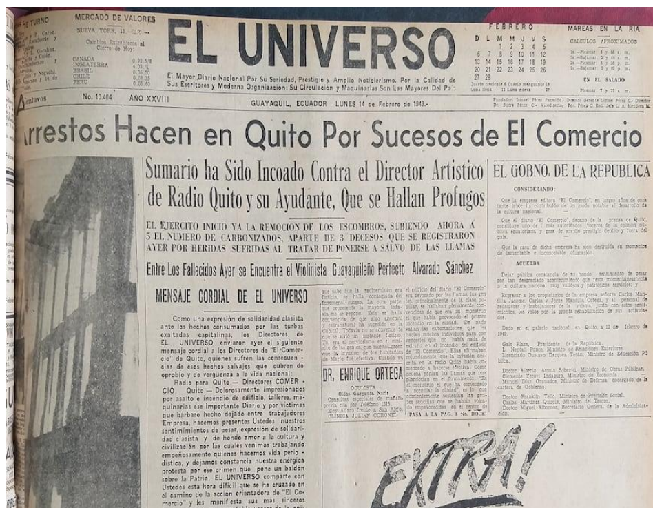
Figura 5: Noticia del incendio de la Radio Quito

Si bien, cada grupo de trabajo debe realizar un trabajo investigativo, es necesario que el docente proporcione fuentes (artículos, recortes de periódicos, etc.). Uno de ellos es lo ya analizado en los diferentes acontecimientos históricos que presenta la novela.