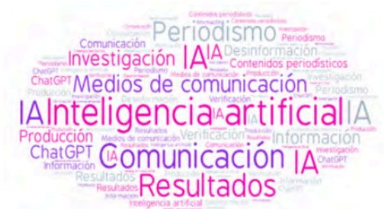
Figura 2: Word cloud de los tópicos destacados

Para llevar a cabo este procedimiento, en primer lugar, se identificaron los principales conceptos relacionados con IA y Comunicación. Para ello, se incluyeron todos los títulos y resúmenes de los 54 artículos en la herramienta WordCounter para detectar la moda de los términos. Las palabras más repetidas se detallan a continuación: inteligencia artificial (107), comunicación (69), contenidos periodísticos (65), medios de comunicación (55), resultados (46), periodismo (44), verificación (35), investigación (31), desinformación (27), producción (23), información (22) y ChatGPT (20) (Figura 2).