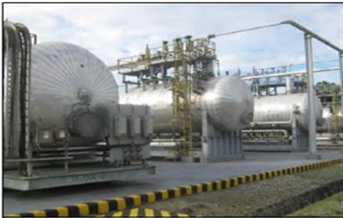
Figura 3. Separadores de agua libre del SPF