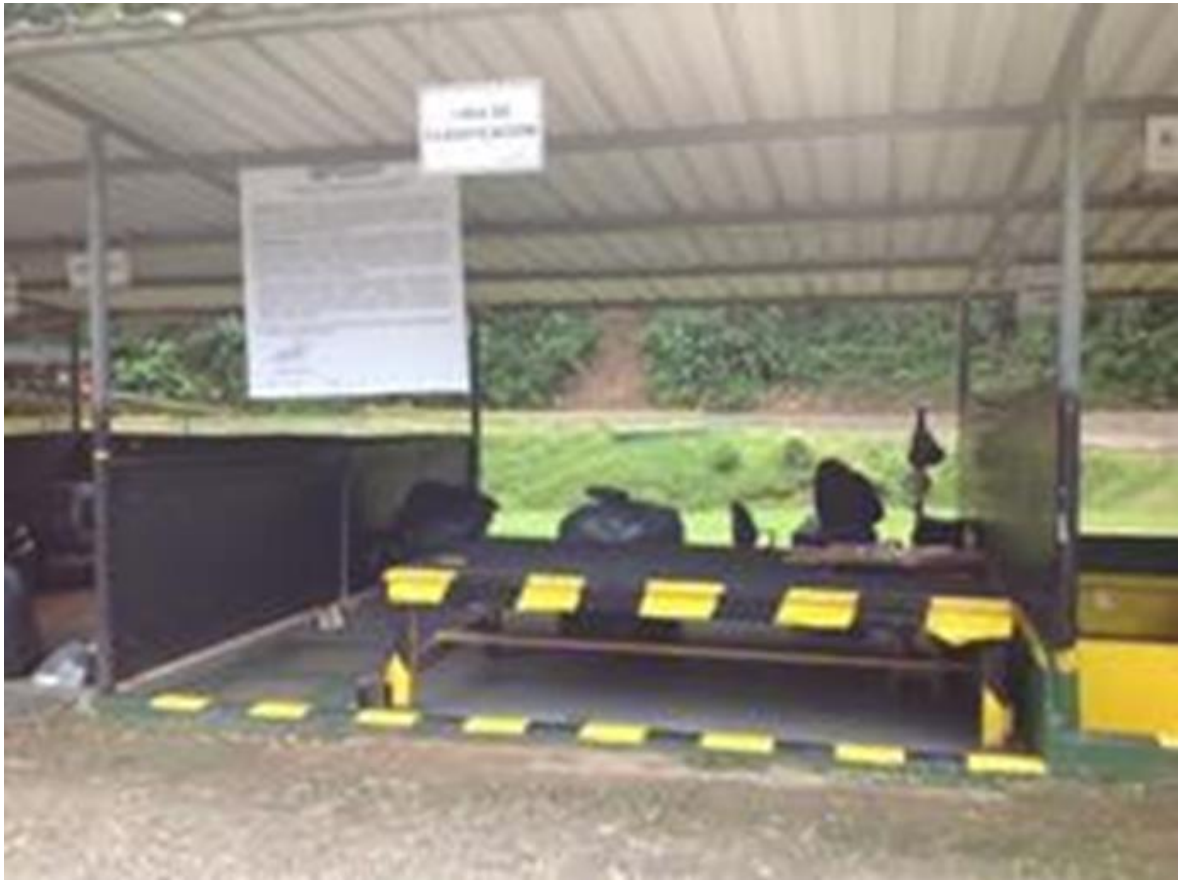
Figura 14. Estación de transferencia de Paraíso (celda de clasificación de desechos).