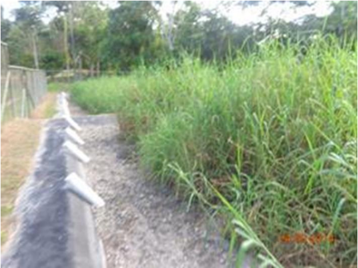
Figura 11. Humedales del SPF.