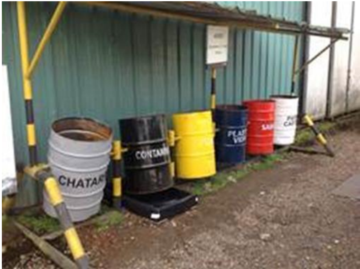
Figura 12. Recipientes para la clasificación inicial de desechos.