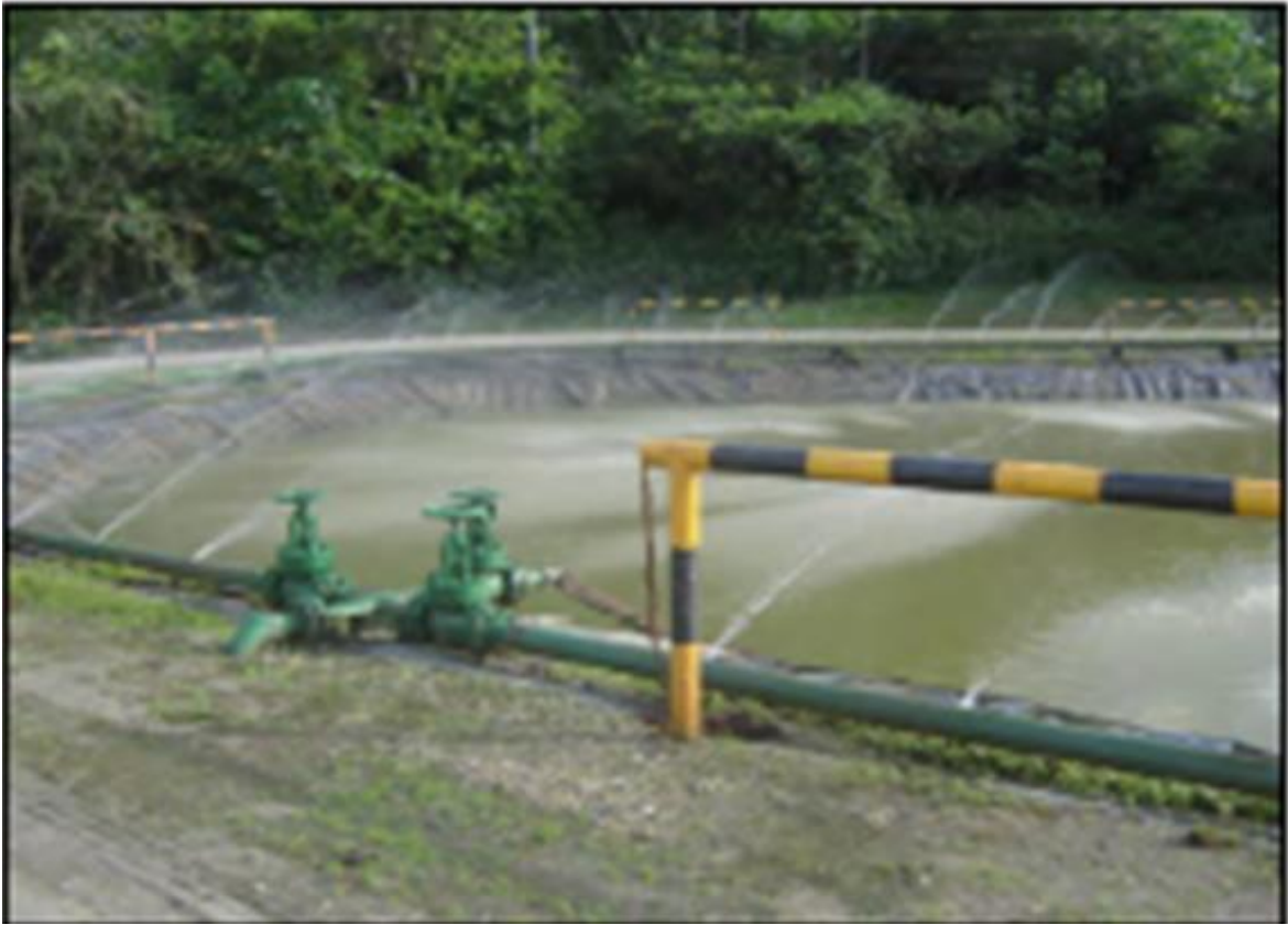
Figura 5. Segunda piscina de retención del SPF, provista de una bomba sumergible que capta el agua para la recirculación de la misma dándole oxigenación.