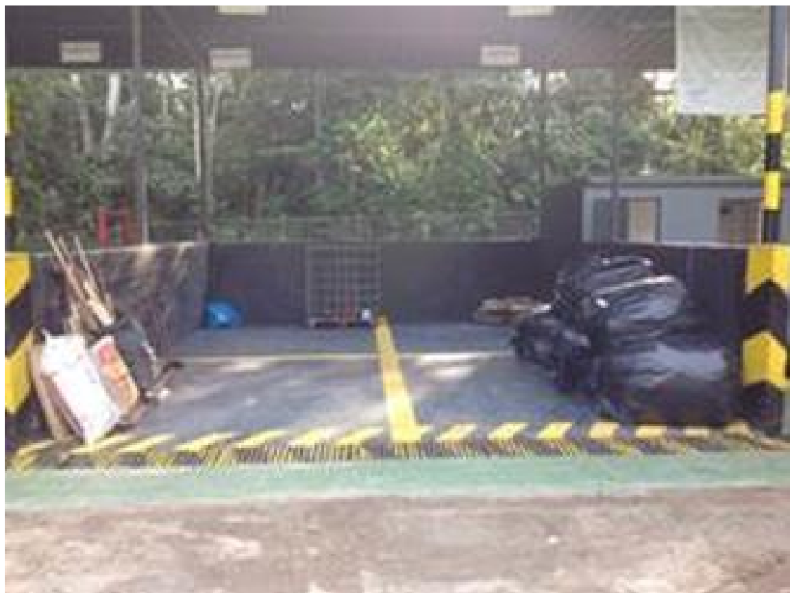
Figura 13. Panorámica de algunas celdas de desechos en la Estación de transferencia de Tubetaro.