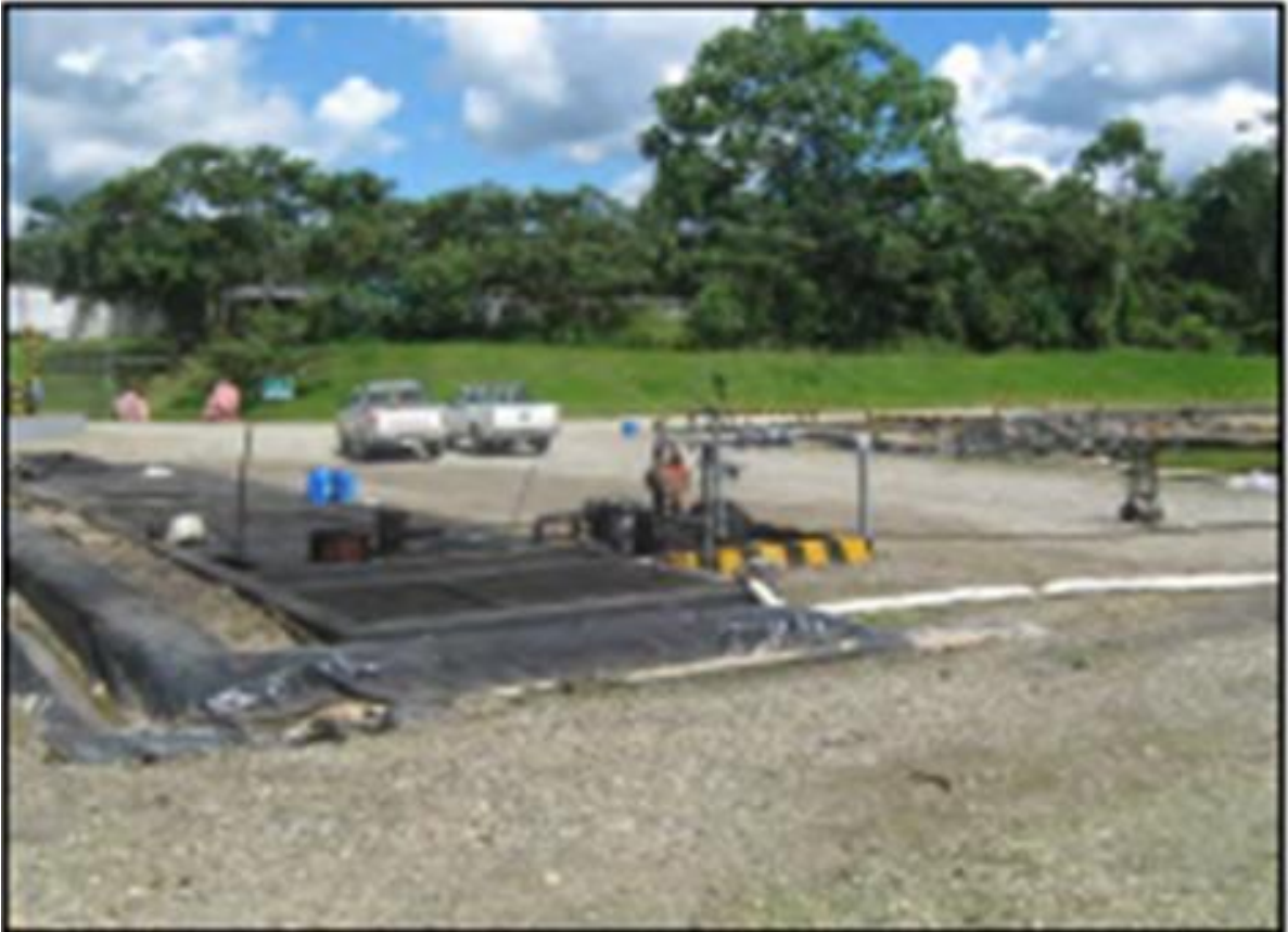
Figura 7. Separador o trampa API del SPF, ubicado antes de la primera piscina de retención.