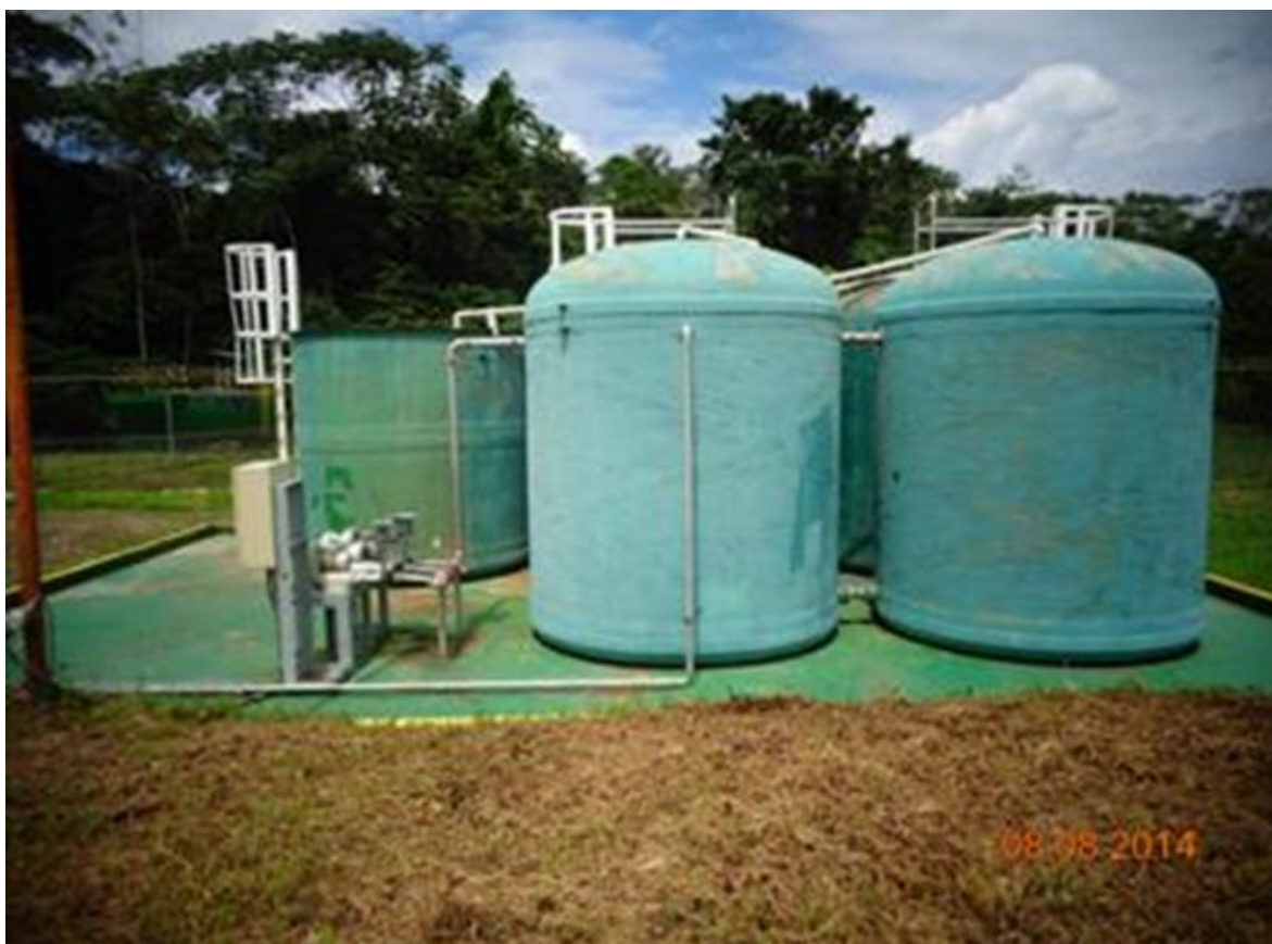
Figura 10. Planta de tratamiento del NPF.