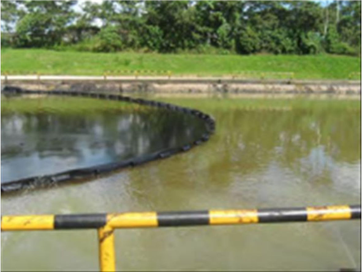
Figura 4. Primera piscina de retención del SPF, provista de una barrera flotante para la retención de aceites.