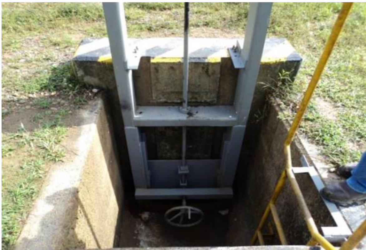
Figura 6. Compuerta de descarga de la segunda piscina de retención del SPF.