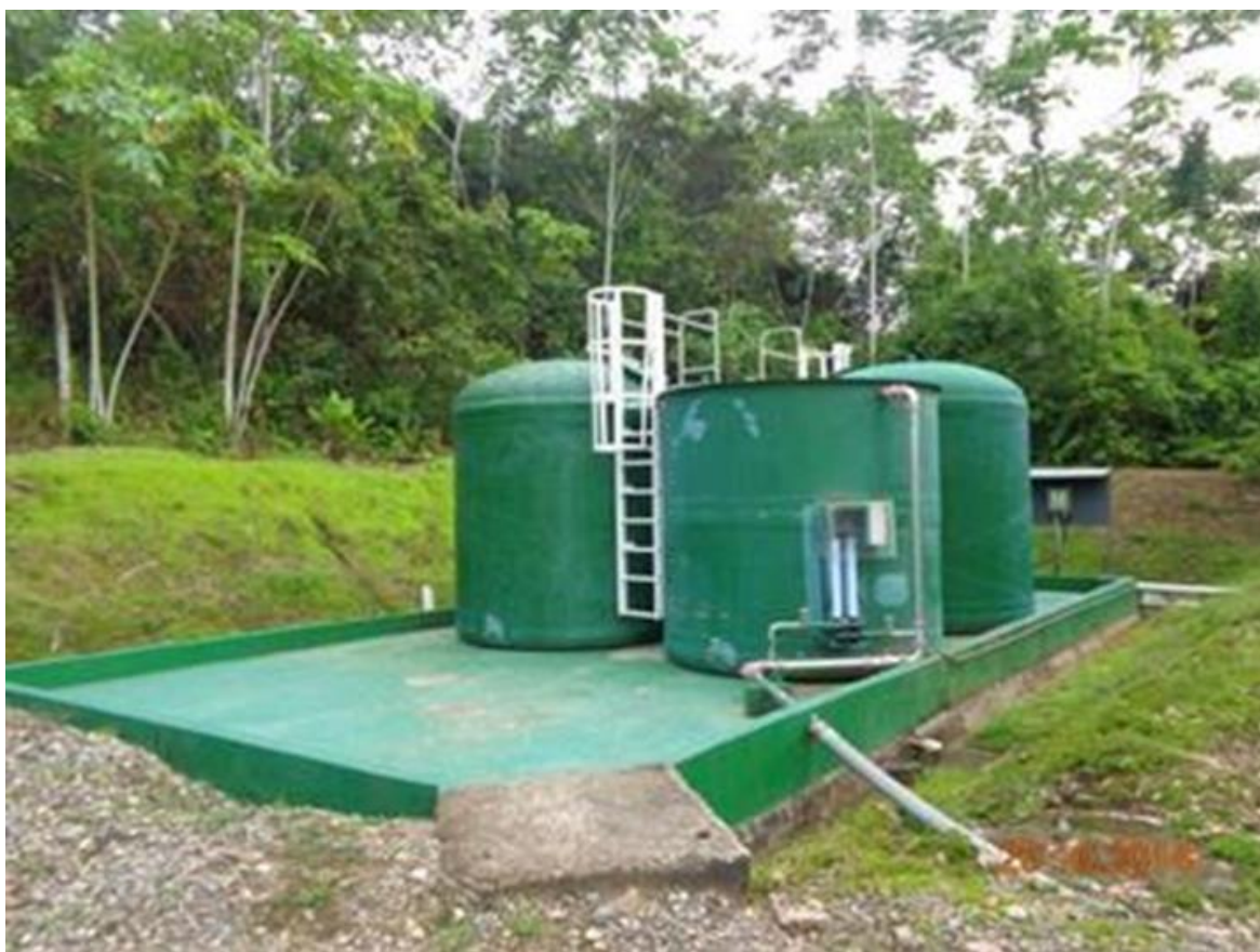
Figura 9. Planta de tratamiento del SPF.