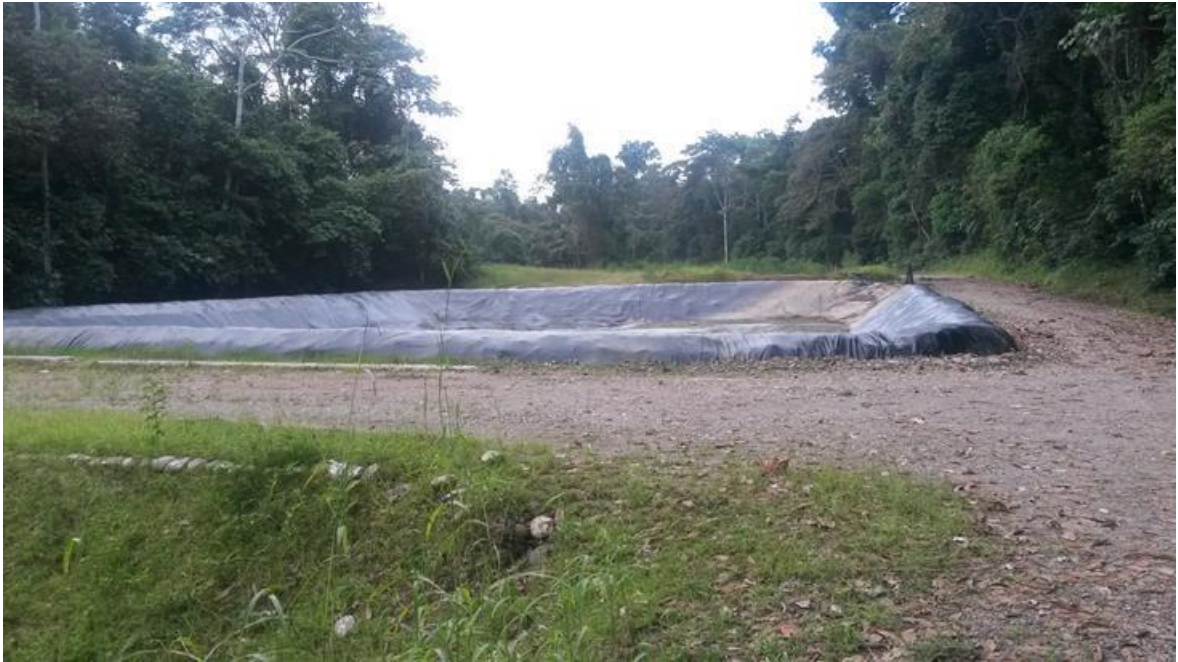
Figura 8. Landfarming del NPF.