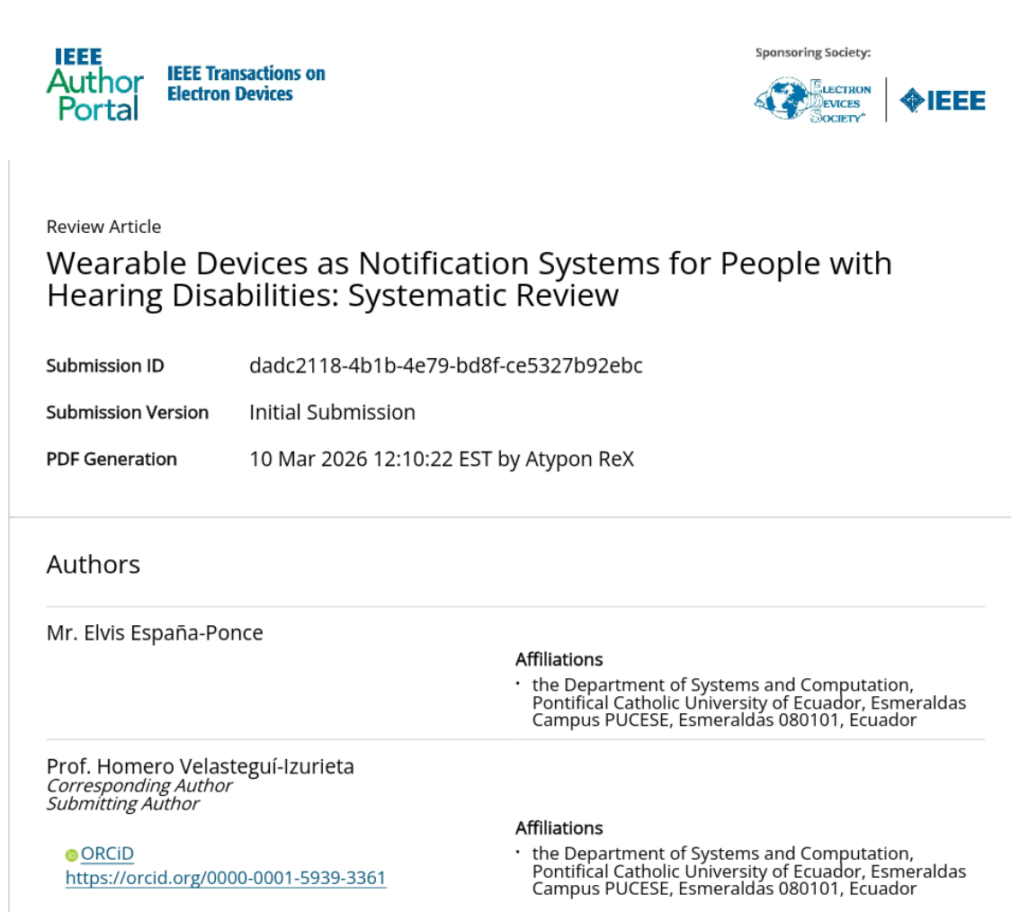
Figure 2: Registro del manuscrito en la plataforma IEEE Author Portal.