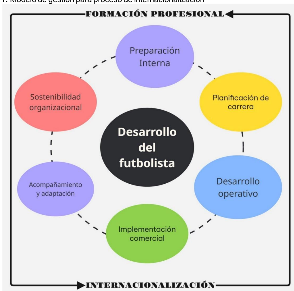
Figura 1. Modelo de gestión para proceso de internacionalización

El modelo de gestión propuesto se sustenta en aportes conceptuales de Zurita (2014), en donde se concibe la gestión deportiva como un sistema integral orientado a la planificación institucional junto con la formación del talento humano y la sostenibilidad organizacional, con el objetivo de obtener resultados deportivos y a su vez económicos. Es por ello, importante estructurar estrategias que fortalezcan la transición de los clubes que se encuentran con limitaciones administrativas, hacia un modelo innovador que se proyecte hacia una internacionalización mayor.