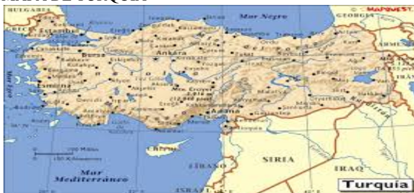
GRAFICO 1 MAPA DE TURQUÍA

Fuente: Alconviajes Elaborado por: Alconviajes