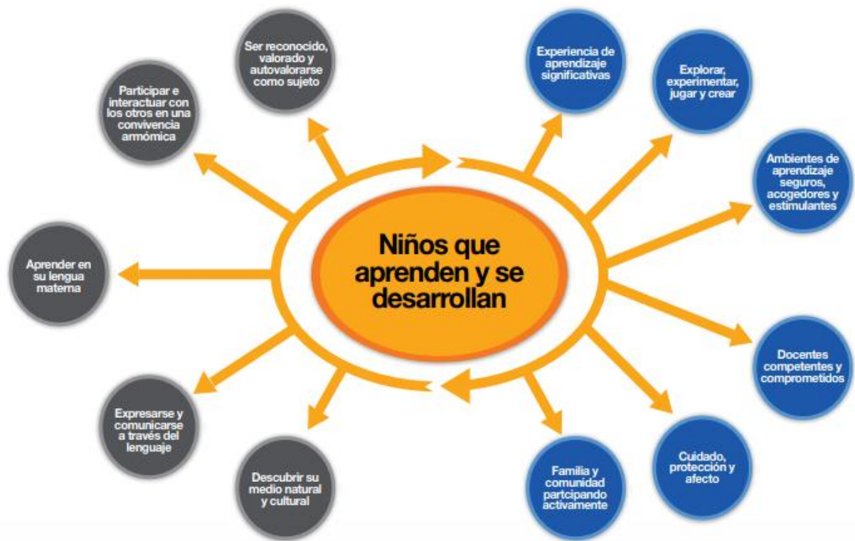
Figura 2. Necesidades de los niños para potenciar su desarrollo y aprendizaje.

A manera de resumen esto es lo que propone el currículo de acuerdo a las necesidades que presentan los niños al momento de aprender: