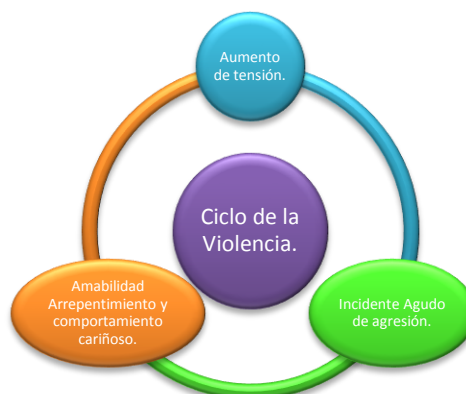
Gráfico # 1.

Autora: Alejandra Albancando.en base a Leonor Walker.