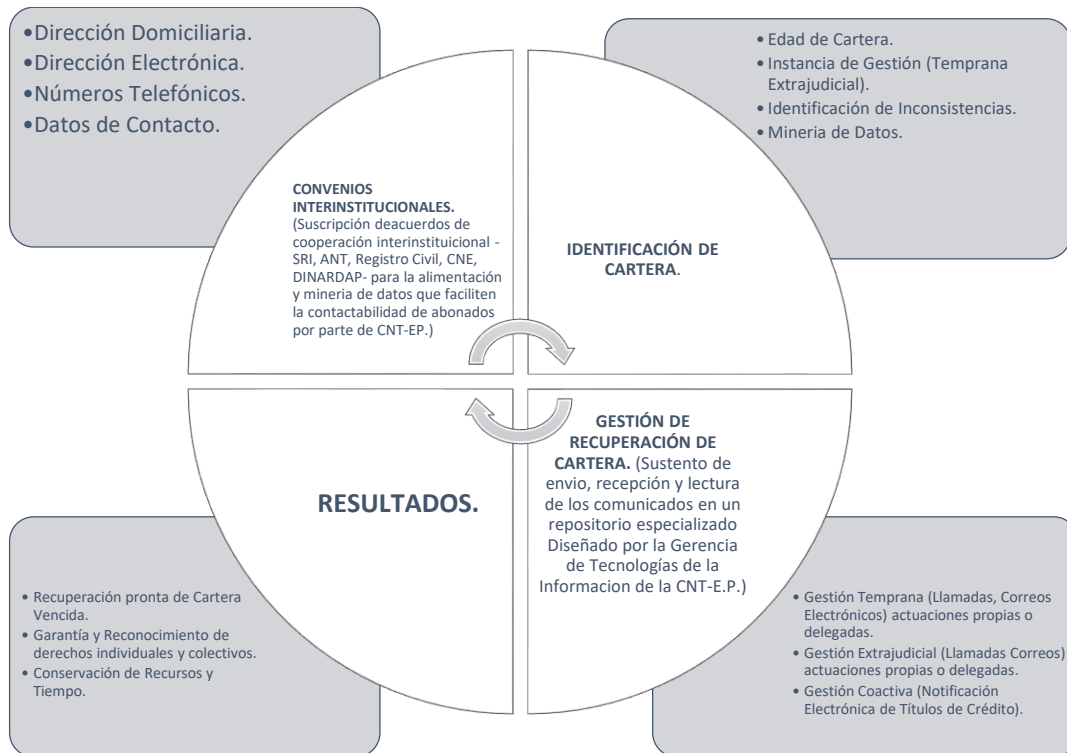
Tabla 4. Proceso de Modelo de Gestión de Recuperación de Cartera CNT-E.P.

Mediante este “Modelo de Gestión” se pretende que el proceso de recuperación de cartera vencida a favor de la CNT-E.P., se realice a través de comunicaciones efectivas y oportunas dirigidas al abonado, cliente o usuario previo a la ejecución coactiva, es decir en instancia de cobranza temprana y extrajudicial. Las gestiones efectivas de cobro se constituyen como tal, cuando existe evidencia clara de la recepción de la comunicación por parte del cliente interesado, para ello, la CNT-EP., deberá constituir un repositorio especializado donde se almacene el respaldo minuciosamente detallado tanto del envío como de la recepción y lectura de los comunicados.