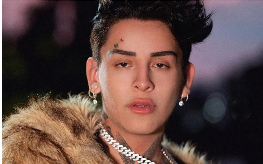
Figura 4. Imagen de Kunno