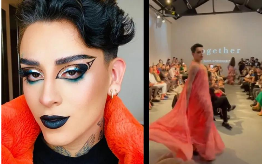
Figura 5. Kunno desfilando en la pasarela del New York Fashion Week.