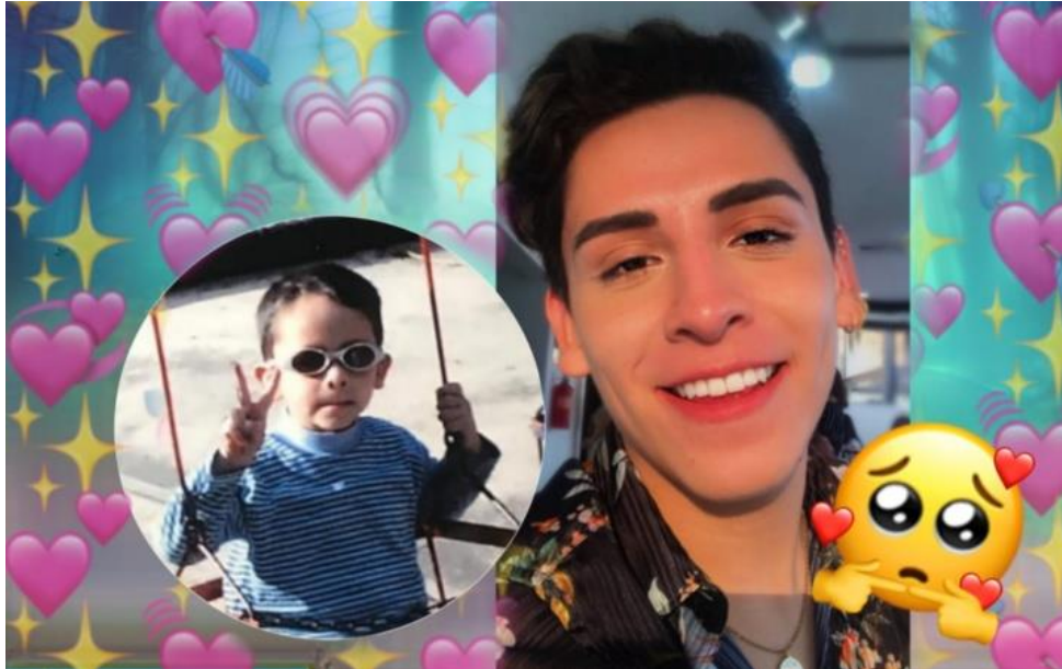
Figura 2. Fotografía de Baby Kunno