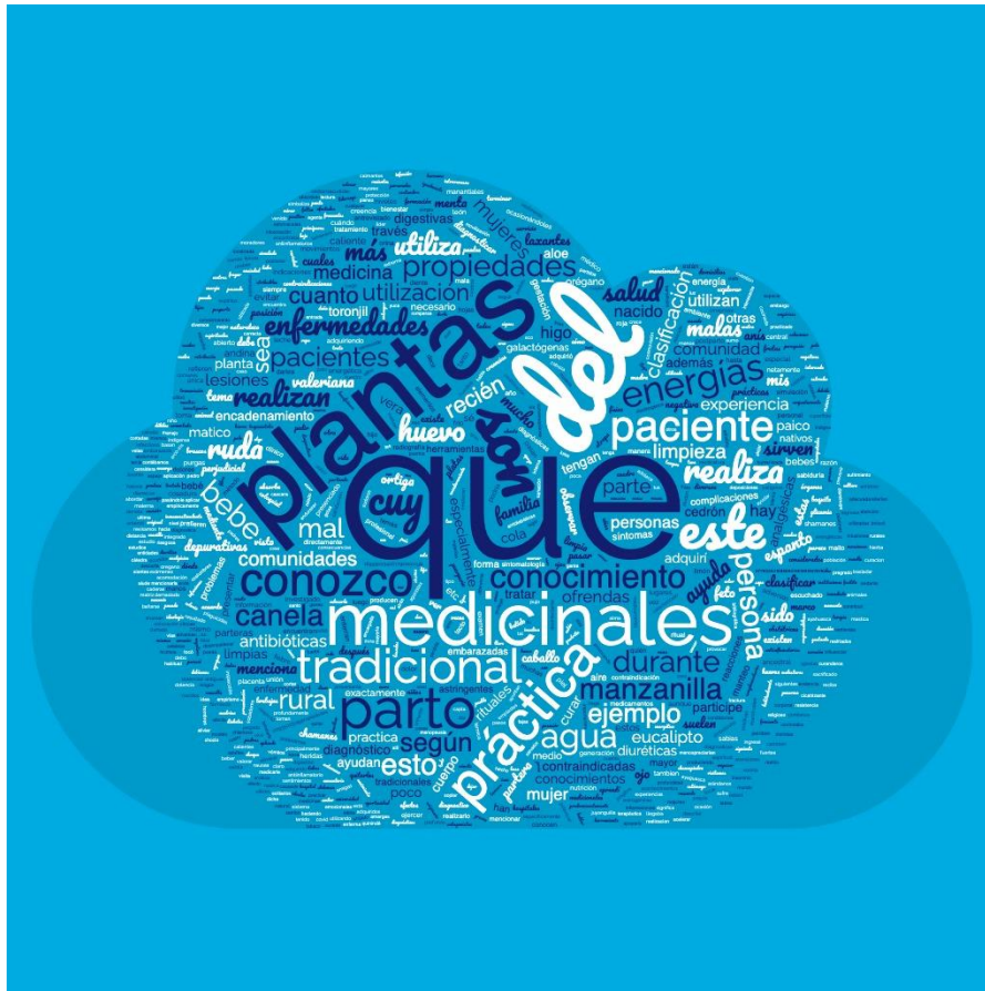
Ilustración 3: Nube de palabras sobre Experiencias prácticas sobre MTA

En lo que respecta a la categoría sobre prácticas sobre MTA, correspondiente a las experiencias de los residentes sobre su participación en conocimiento en cuanto a los rituales de sanación utilizados por los profesionales de la medicina ancestral, así como las técnicas implementadas para realizar un diagnóstico en función de la clasificación de enfermedades de estas culturas y los tratamientos que utilizan las plantas medicinales.