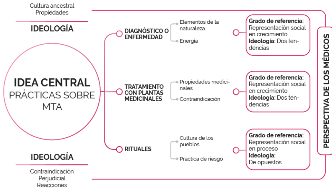
Ilustración 4: Experiencias prácticas sobre MTA