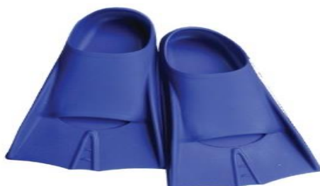
Figura 2. Aletas de natación

ALETAS: Las aletas proporcionan una amplia superficie para impulsarte por el agua. Te permiten nadar utilizando los poderosos músculos de tus piernas. Te permite moverte más eficientemente y dejan libres tus manos. También conocido como: aletas, aletas de natación, flippers, palas etc.