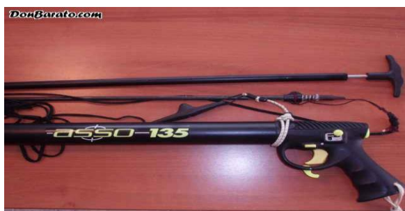
Figura 3 Fusil de aire comprimido.

Este instrumento de gran ayuda para la pesca existe no solo en un tipo sino en varios, ya que cada uno se diferencia por la calidad estilo comodidad ventajas y conveniencias para cada persona. Según (Hernández, 2017), Los primeros arpones eran de maderas con bandas de goma, sim embargo la búsqueda de un excelente fusil de pesca submarina dio una variedad de innovaciones tecnológicas como la aparición de fusiles neumáticos, de co2 o fusiles hidráulicos. Esta búsqueda tecnológica por el fusil de pesca submarina ha sido magnifica y apasionante, no obstante alguno han regresado a la forma cotidiana como los tiempos anteriores.