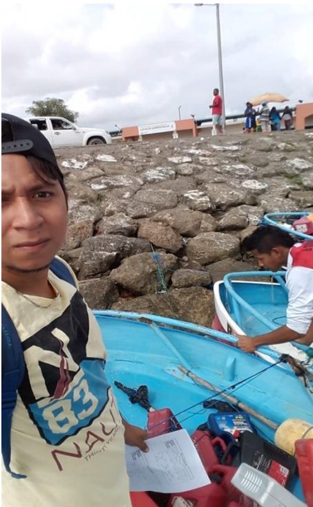
Anexo #2 Fichas de observación