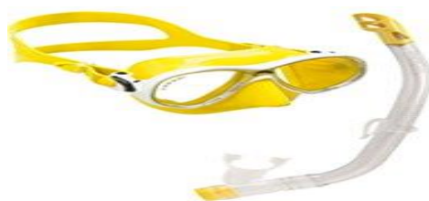
Figura 1. Careta de buceo con snorkel

CARETE DE BUCEO CON SNORKEL: El tubo respirador generalmente de unos 30 centímetros de largo y un diámetro interior de entre 1,5 y 2,5 centímetros, por lo general en L o en forma de J y provista de una boquilla en el extremo inferior, y fabricada con caucho o plástico. Se usa para respirar el aire por encima de la superficie del agua cuando la boca y la nariz del atleta se encuentran sumergidas, viene con una careta la cual ayuda tener visibilidad debajo del agua.