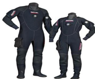
Figura 3 trajes para buzo

Traje de buceo: El objetivo fundamental de un traje de buceo es la protección contra el frío, limitando al máximo la pérdida de calor que se produce cuando el buzo ingresa a un medio más frío como es el agua del mar y ayudando a mantener la temperatura corporal en niveles aceptables. De ahí que también se lo conozca como traje isotérmico.