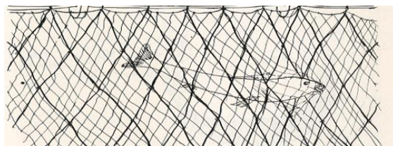
Figura 4 Nailon

Este arte de pesca es pasivo ya que no tiene mucha selectividad puesto que los peces se lesionan y no mueren al instante durante la captura lo que deja como resultado una calidad no muy buena del producto.