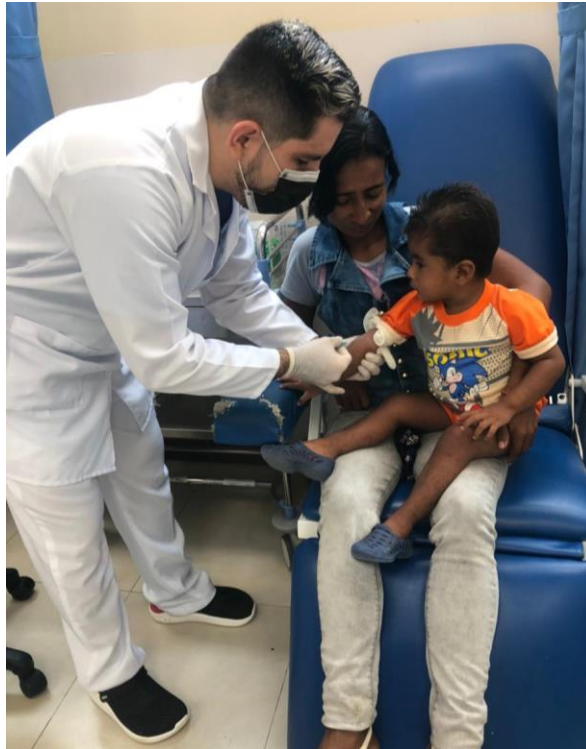
Figura 1. Tomando muestras a menor de 12 meses.