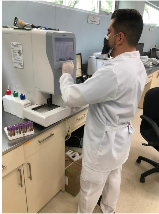
Figura 3. Realizando biometrías hemáticas en el equipo BCC-3000B.