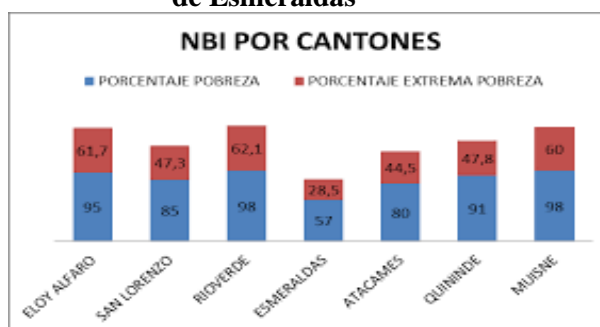
Gráfico 1. Porcentajes de pobreza y extrema pobreza por cantones en la provincia de Esmeraldas

Es decir, que cuatro de diez afroecuatorianos viven en situación de pobreza, sobre todo en la zona rural donde la extrema pobreza es tres veces mayor y supera en unos 20 puntos porcentuales a los centros urbanos, adicional a esto se añade la diferencia de género, donde más mujeres que hombres son pobres, (INEC, 2010, pág. 5).