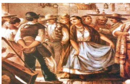
Ilustración 4 Baile del Fandango .

Anónimo, Fandango de las clases populares en México. 36