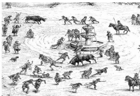
Ilustración 2 Celebración taurina siglo XVIII

Celebración plaza mayor de Quito en el siglo XVIII. Obra Anónima de la Escuela Quiteña, Foto: Museo de la Moneda Bogotá. 30