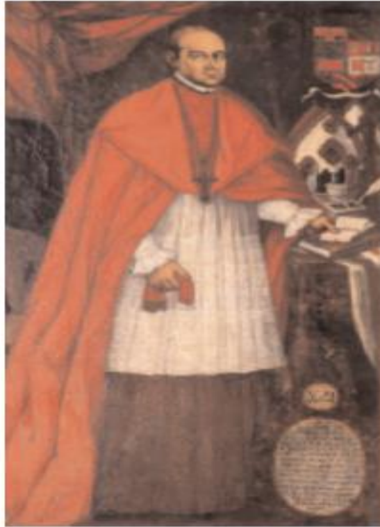
Obispo Juan Nieto Polo del Águila. Sala Capitular del Cabildo Eclesiástico. 40

La Iglesia en la Real Audiencia de Quito durante el siglo XVIII fue la unión de varios cuerpos eclesiásticos, 41 caracterizados por su importante gestión en materia de control y administración social. Su presencia regía el devenir cotidiano de los pobladores de forma constante y directa, tanto en las ciudades como en pueblos rurales. Durante la primera mitad del siglo en mención, el obispado estuvo administrado por varios personajes ilustres, entre ellos Andrés de Paredes y Armendáriz, que desempeñó su cargo desde el 18 de junio de 1731 al 3 de julio de 1745. Su gestión al frente del obispado fue