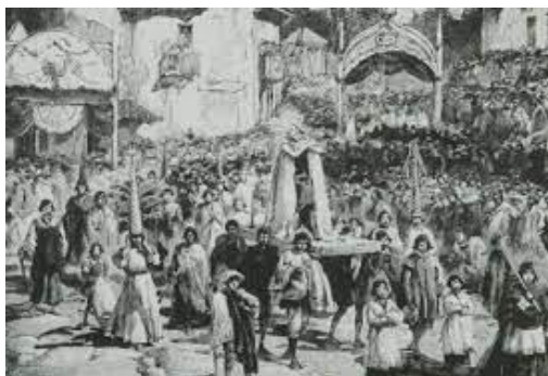
Fiesta del Corpus Christi en la plaza mayor de Quito, siglo XVIII. Anónimo 32 .

La fiesta del Corpus Christi nació como una procesión religiosa que buscaba conmemorar la presencia de Cristo en el territorio de la Real Audiencia, su realización proponía que los fieles asistan y compartan un momento de plegaria hacia la figura de Cristo, incentivando la presencia de cantos y sonidos de instrumentación baja, en señal conservadora y respetuosa con el momento. Según Garavaglia & Marchena (2005):