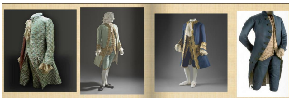
Ilustración 5 Vestidos de Golilla siglo XVIII

Para la época, la fiesta pública debía imponer respeto y poder. En este caso, la fiesta de Sánchez de Orellana además de merecer una adecuada cantidad de recursos, también poseía como característica propia la necesidad de engalanar calles, plazas, casas e inclusive se solicitaba el uso de cierto tipo de prendas, como el vestido de golilla para todos los que asistan, siendo estos obligados a ir por mandato de una cédula real vigente en la época.