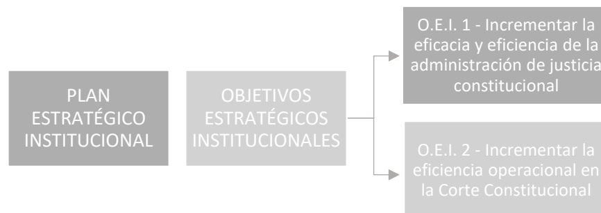
Figura N° 1 Alineación Planificación estratégica institucional - procesos

La propuesta de modelo de gestión por objetivos para la gestión administrativa de la CCE, establece en primer lugar la definición de un Plan operativo de corto plazo que contenga los objetivos de cada una de las unidades administrativas alineados con la Planificación estratégica institucional, y que precisen los resultados que se desean alcanzar durante el ejercicio fiscal, así como los correspondientes indicadores para medir el rendimiento.