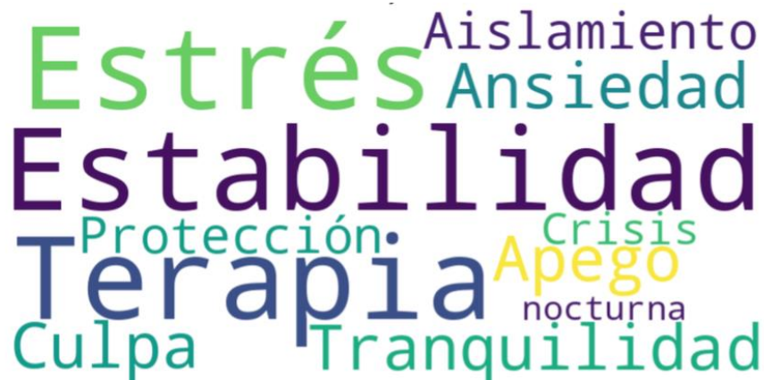
Ilustración 3 Nube de palabras sobre la salud mental y emocional

Fuente: base de datos. Autoras: Carolina Armas y Arleth Jarrin, 2025