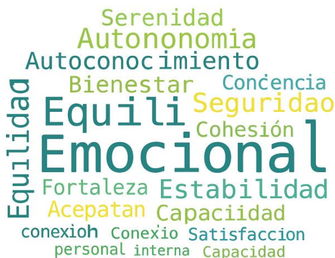
Ilustración 1 Nube de palabras sobre el concepto de la salud mental

Fuente: base de datos. Autoras: Carolina Armas y Arleth Jarrin, 2025