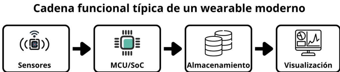
Ilustración 1. Arquitectura funcional de un wearable moderno

Nota: El gráfico evidencia cómo cada módulo del sistema interactúa, permitiendo la captura, procesamiento, visualización y comunicación de datos en tiempo real o asincrónico. (Godfrey et al., 2018)