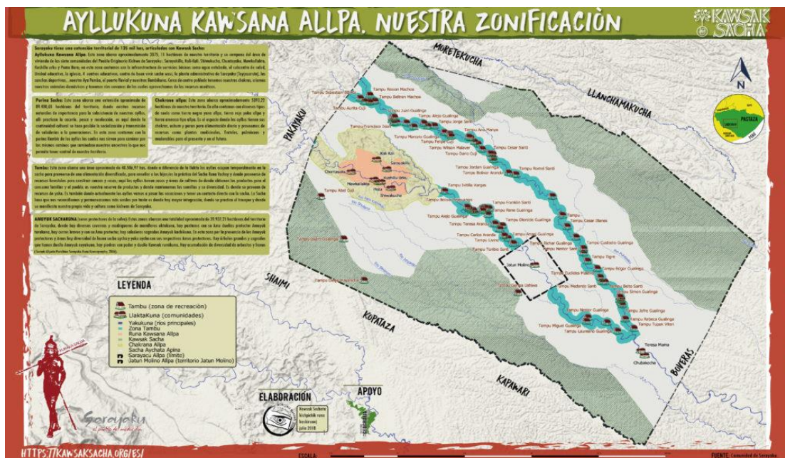
Figura 2. Territorio Sarayaku.

años de lucha y protesta social. Finalmente, en 2004 es reconocida su personería jurídica como Pueblo Originario Kichwa de Sarayaku por el Consejo de Desarrollo de Pueblos y Nacionalidades Indígenas del Ecuador 8 y se registra su Estatuto.