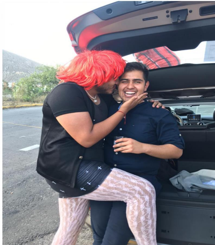
Imagen de una viuda del 31 de diciembre mientras interactúa con un amigo, obtenida de uno de los entrevistados