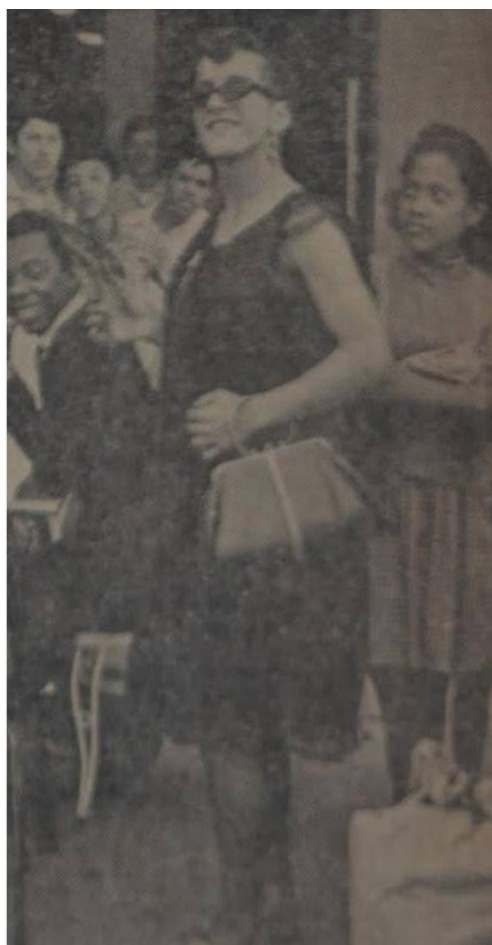
Imagen de una viuda concursante obtenida del Diario el Universo (1969)

Pese a la llamativa imagen que puede representar una viuda como en el grafico 4, el premio que pudo ganar, y lo colorido que pudo ser el concurso, hay que mencionar que